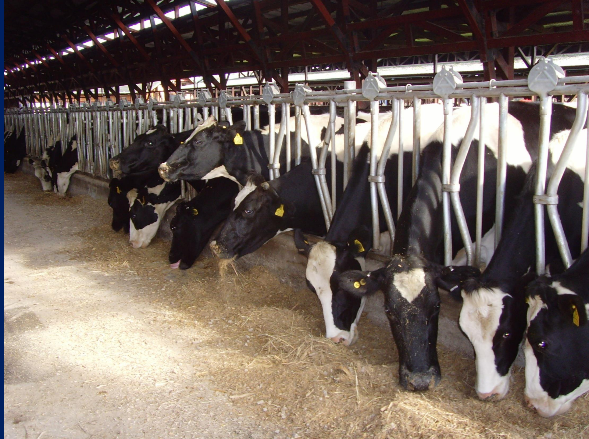
Vacas consumiendo una TMR en estabulación parcial