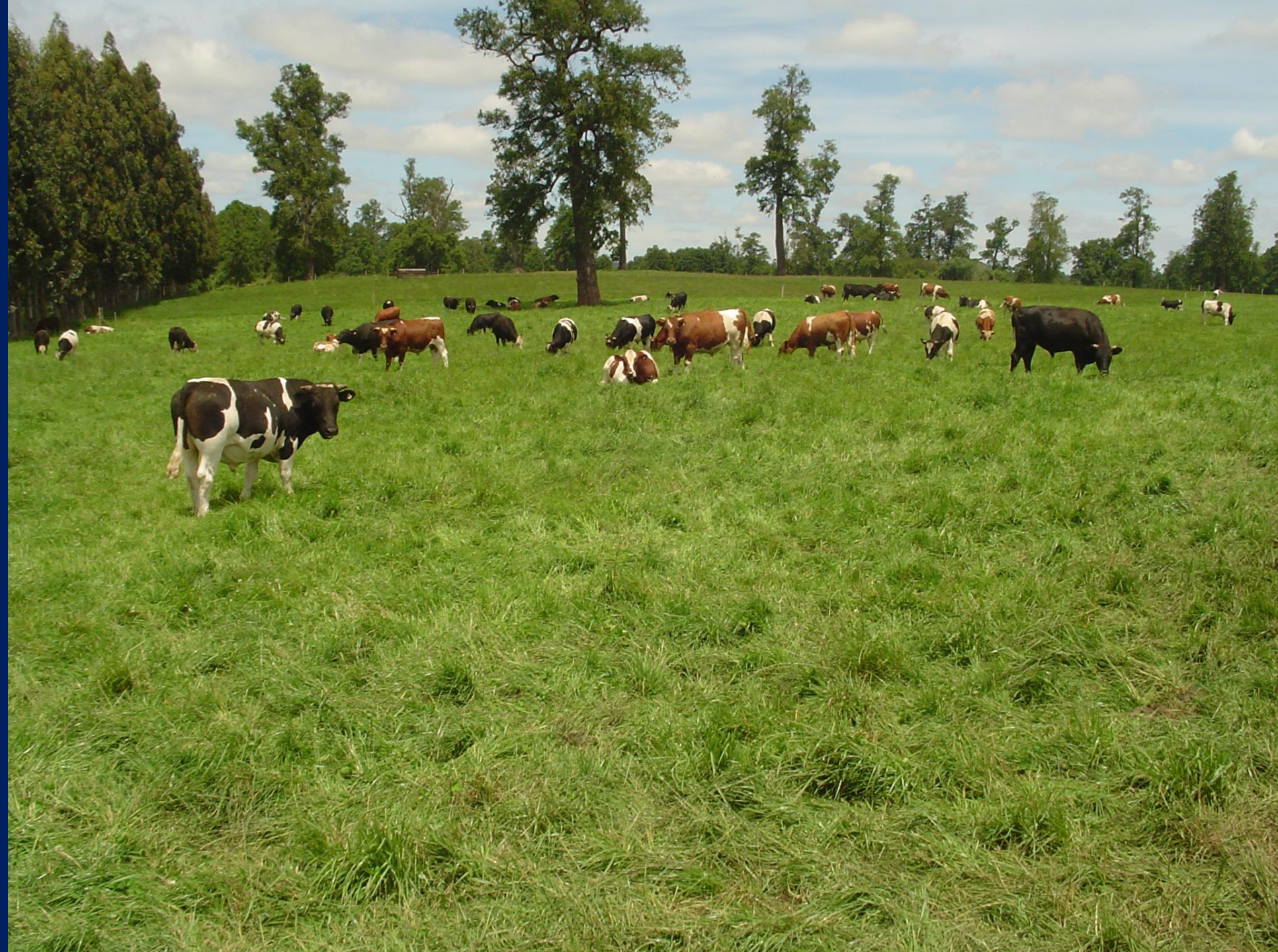
Sistema de engorda en pastoreo