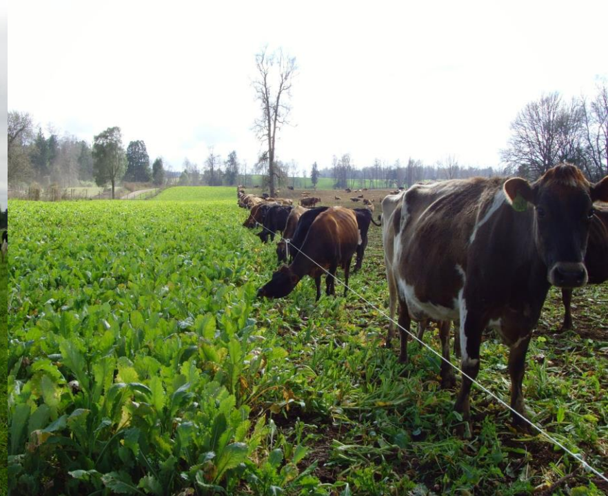
Diversidad genética bovina