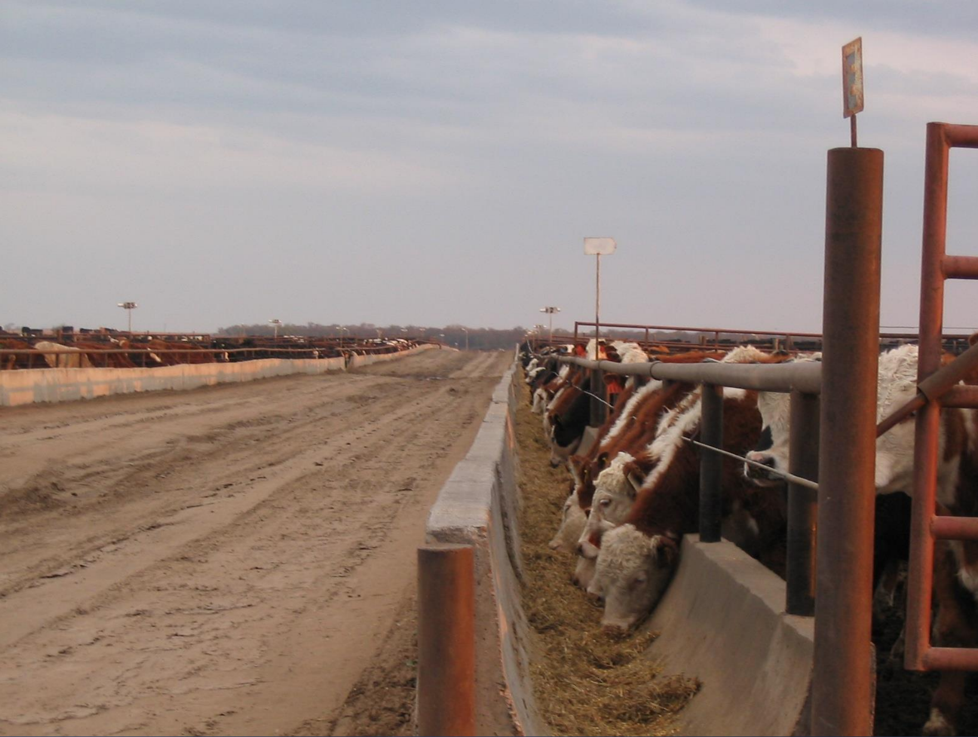
Engorda en corral (feedlot)