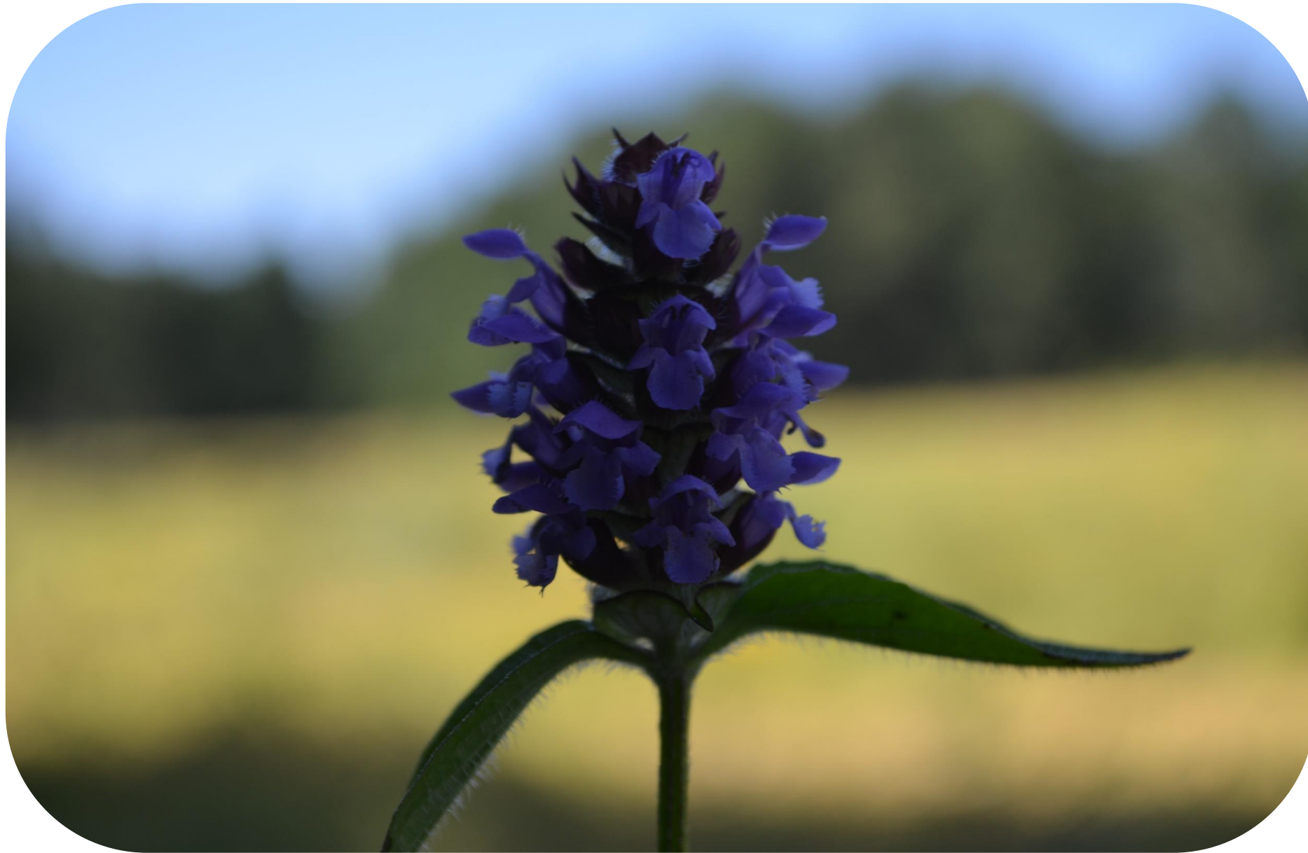
Prunella vulgaris L. Hierba mora Ciclo perenne