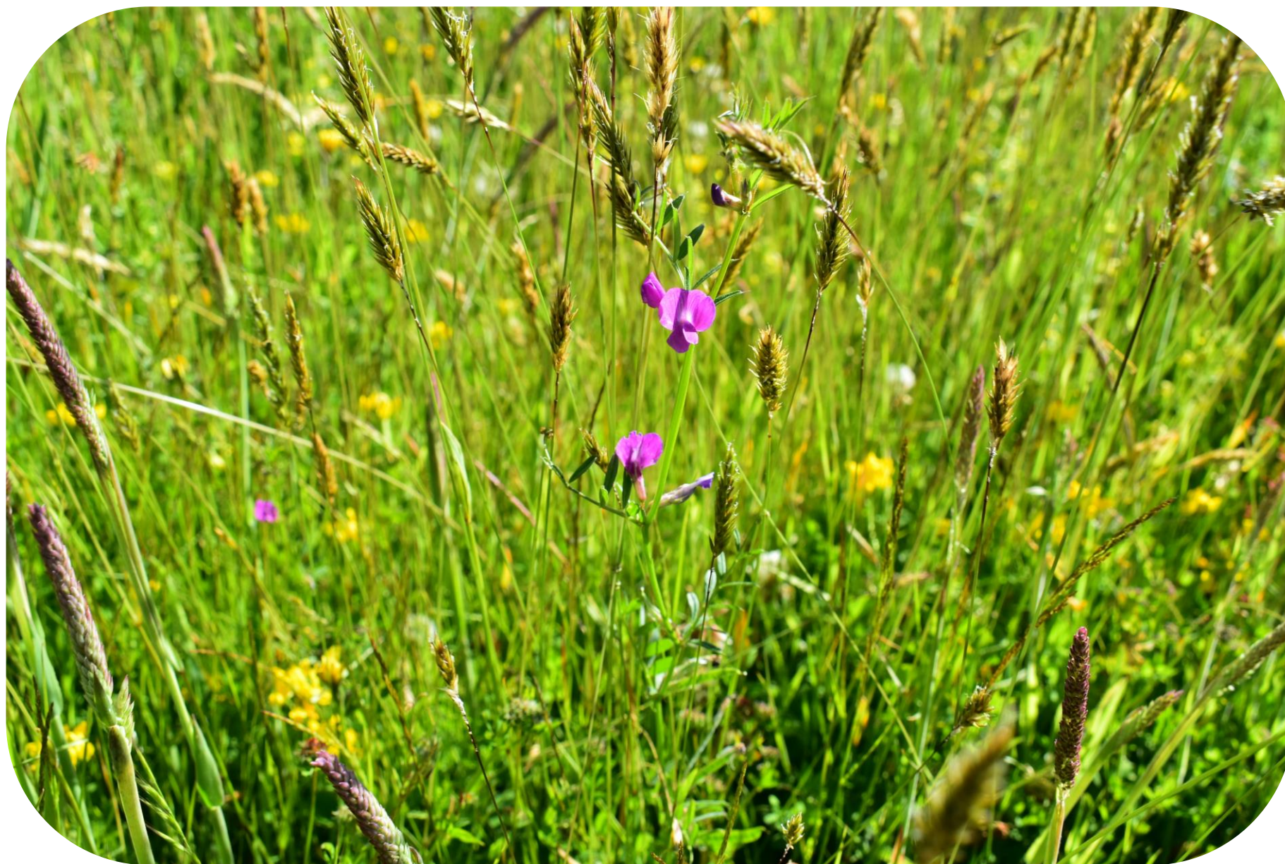
Vicia sativa L. Arvejilla Ciclo anual