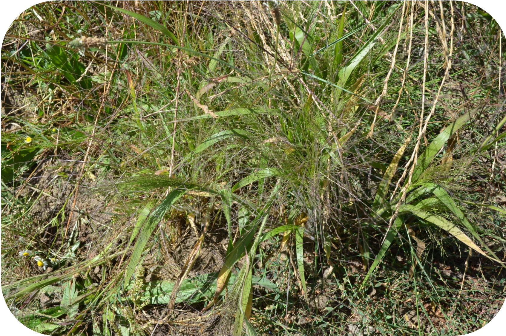
Panicum capillare L. Pasto de la perdiz Ciclo anual