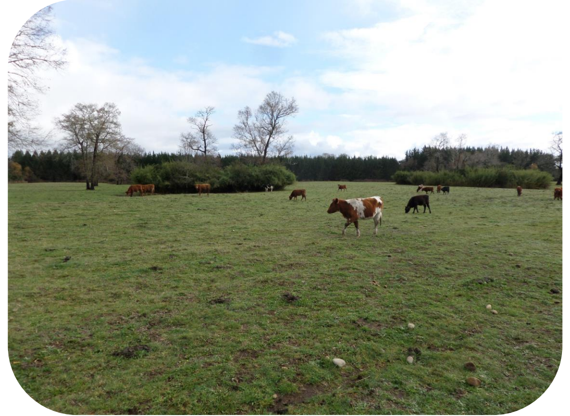
Año 3 Pastoreo con alta carga