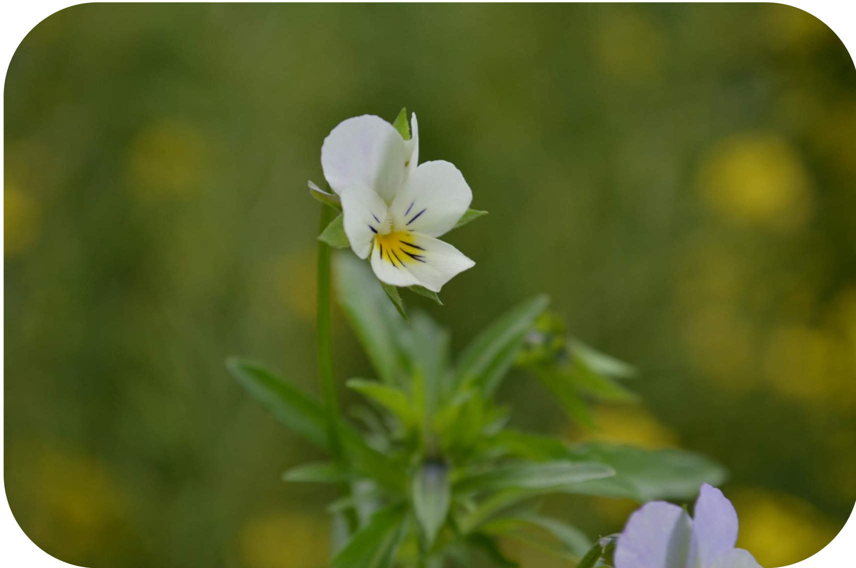
Viola arvensis Murray Pensamiento Viola Ciclo anual o bianual