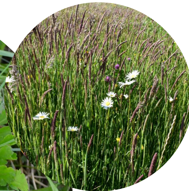
Laucanthemum vulgare Lam. Margarita Ciclo perenne