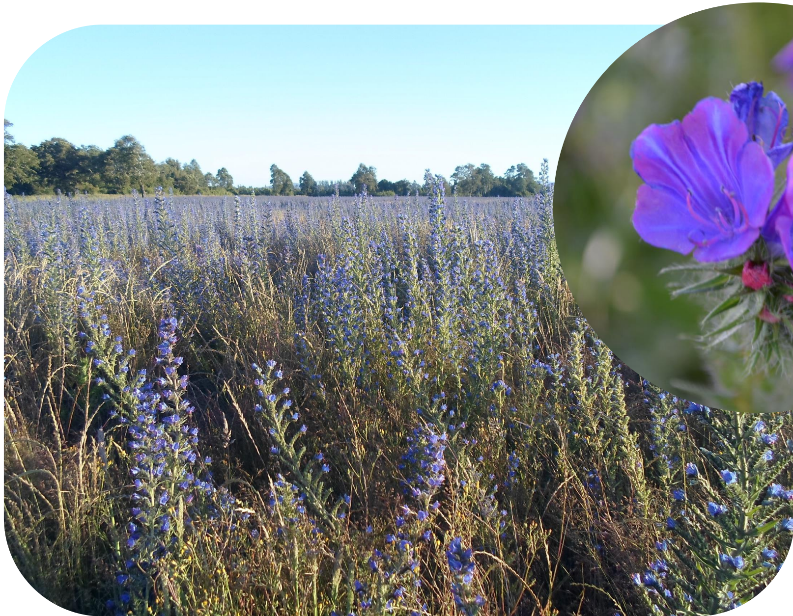
Echium vulgare L. Hierba azul o Viborera Ciclo bianual