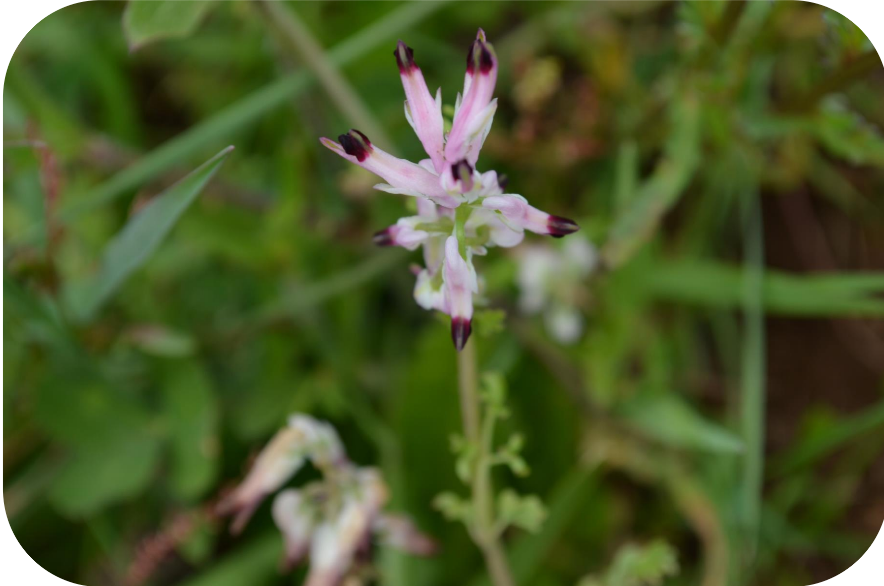
Fumaria capreolata L. Hierba de la culebra Ciclo anual