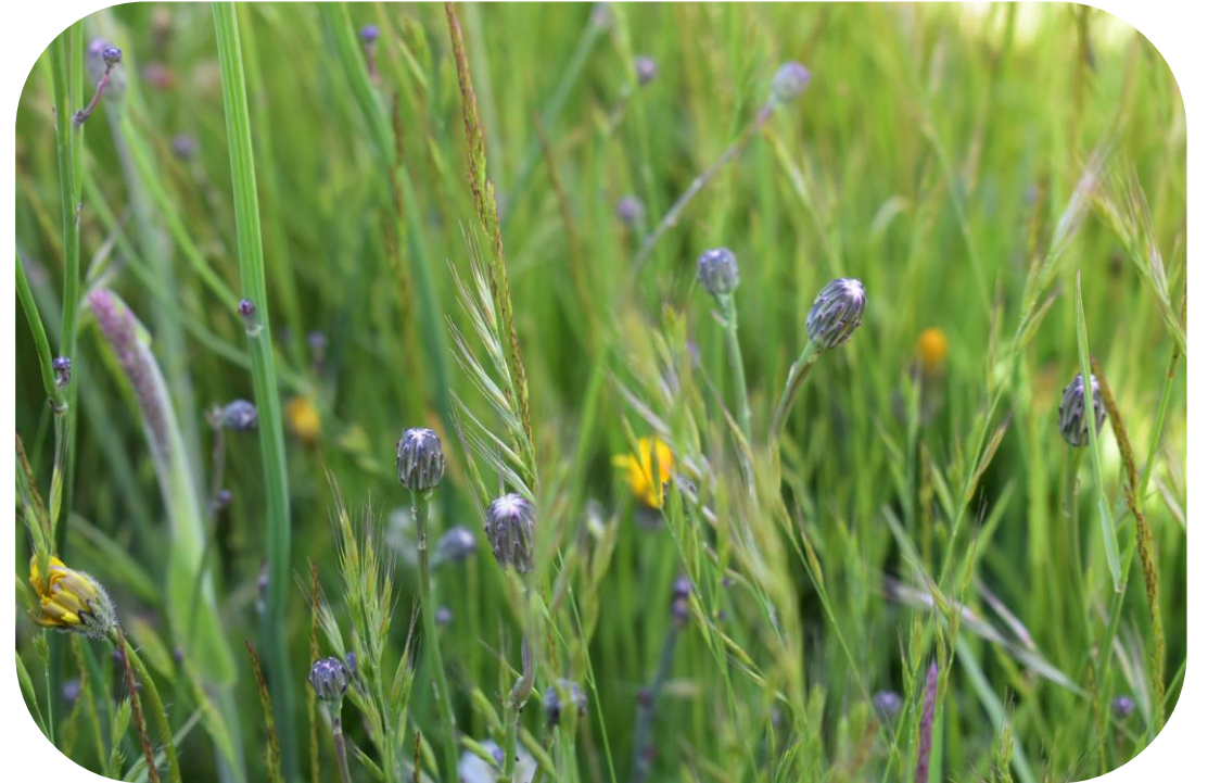
Vulpia bromoides (L.) Gray Vulpia Ciclo anual