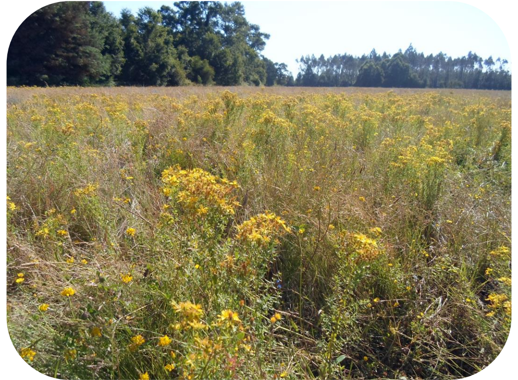
Hypericum perforatum L. Hierba de San Juan Ciclo perenne