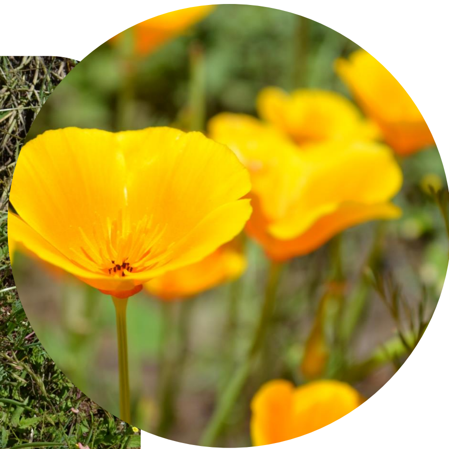
Eschscholzia californica Cham. Dedal de oro Ciclo perenne