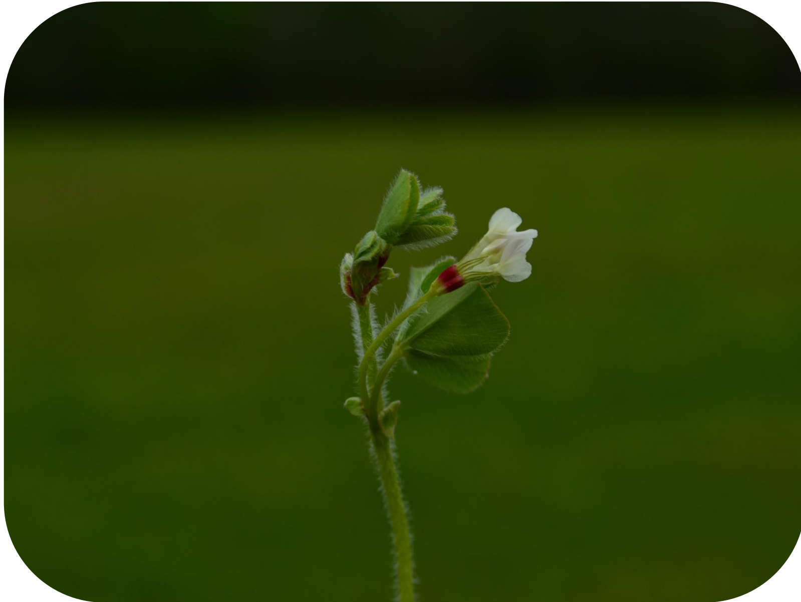
Trifolium subterraneum L. Trébol subterráneo Ciclo anual