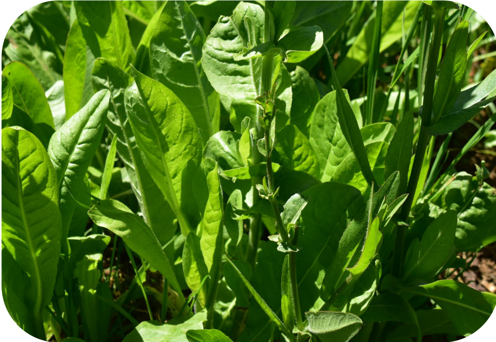
Cichorium intybus L. Achicoria Chicory Ciclo anual o bianual