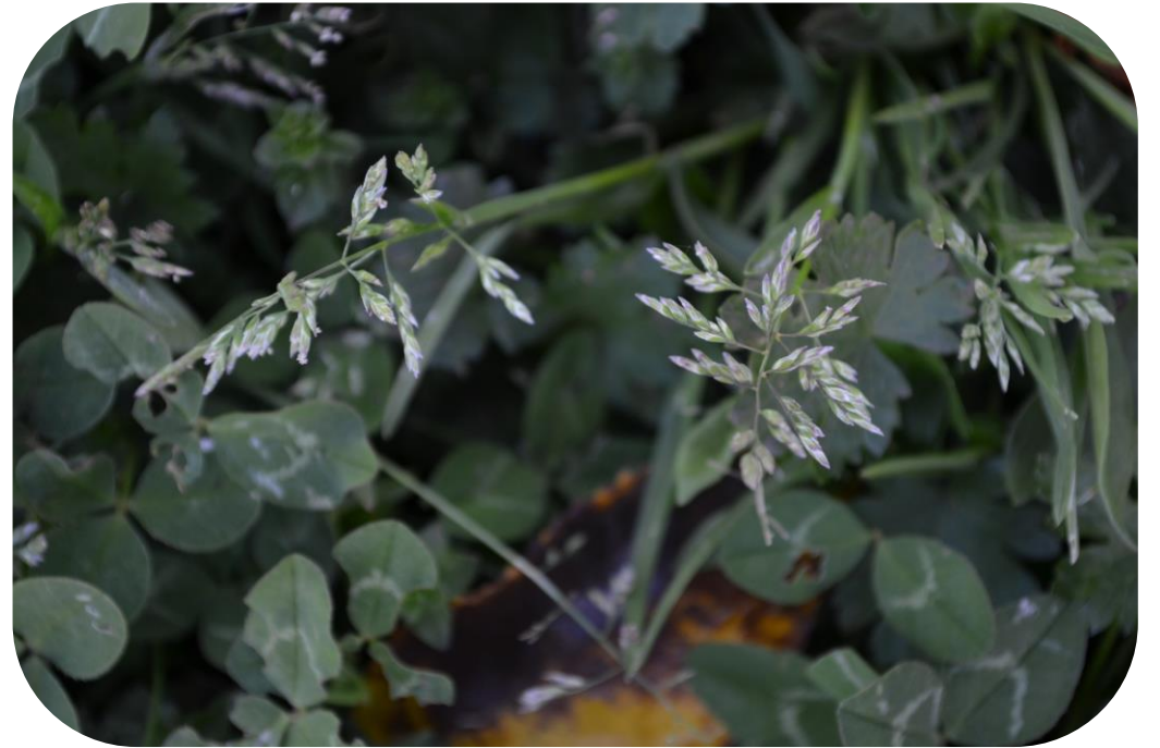
Poa annua L. Piojillo Hierba de la perdiz Ciclo anual