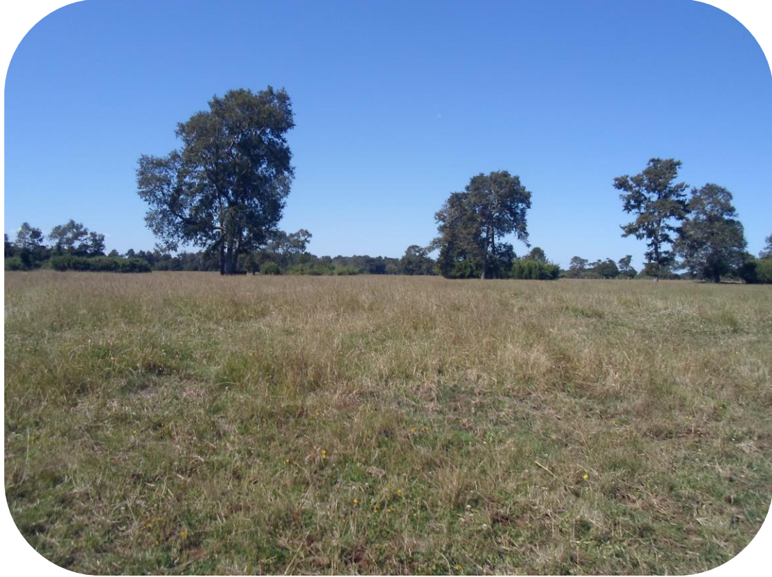
Año 3 Aumento de cobertura