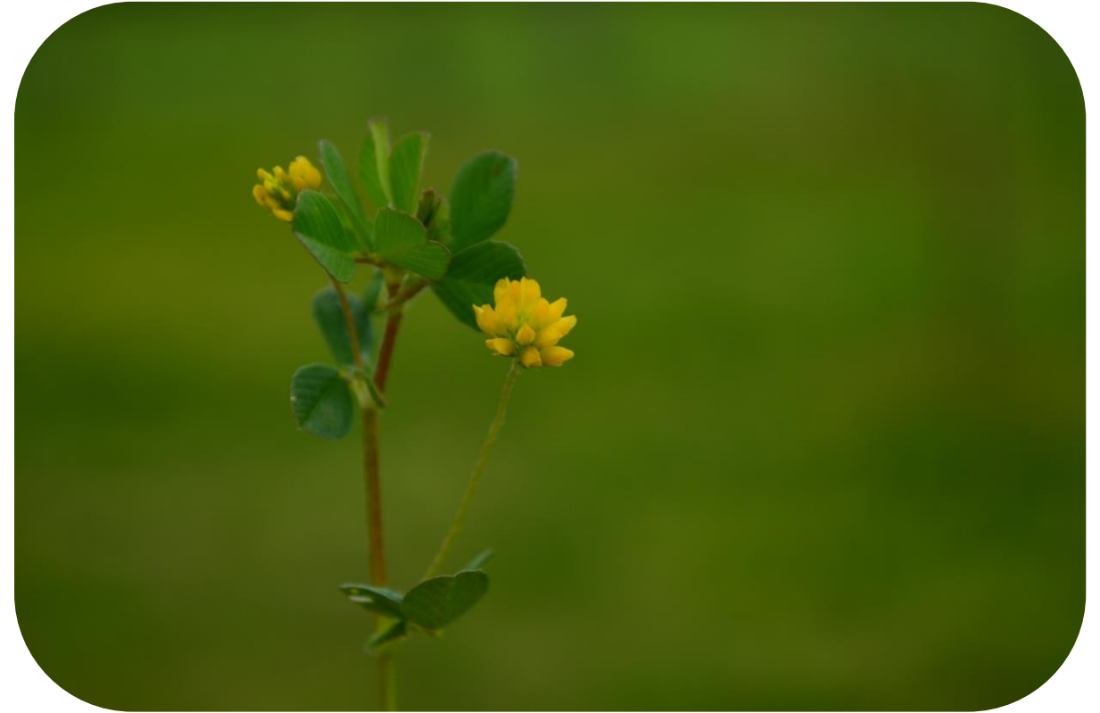
Trifolium filiforme L. Ciclo anual