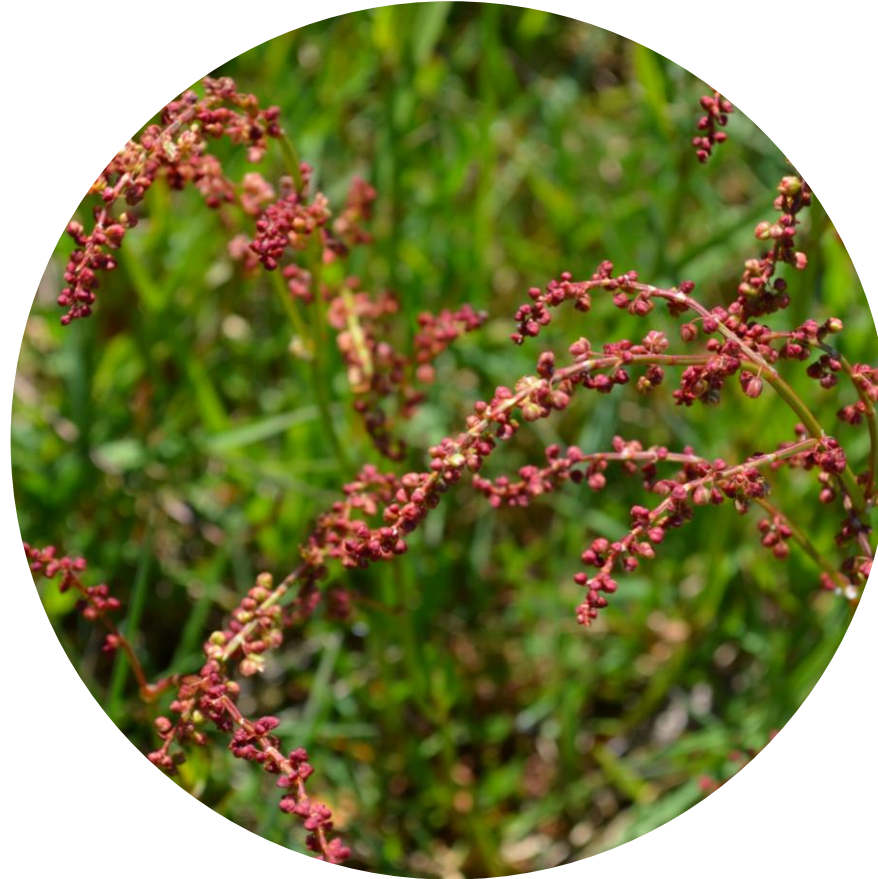
Rumex acetosella L. Vinagrillo Ciclo perenne