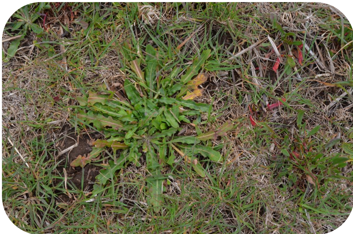
Leontodon saxatilis Lam. Chinilla Ciclo anual