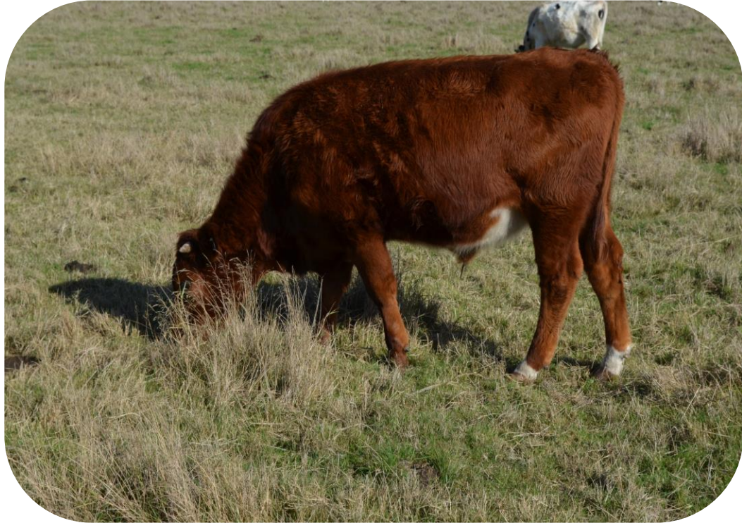
Año 2 Pastoreo