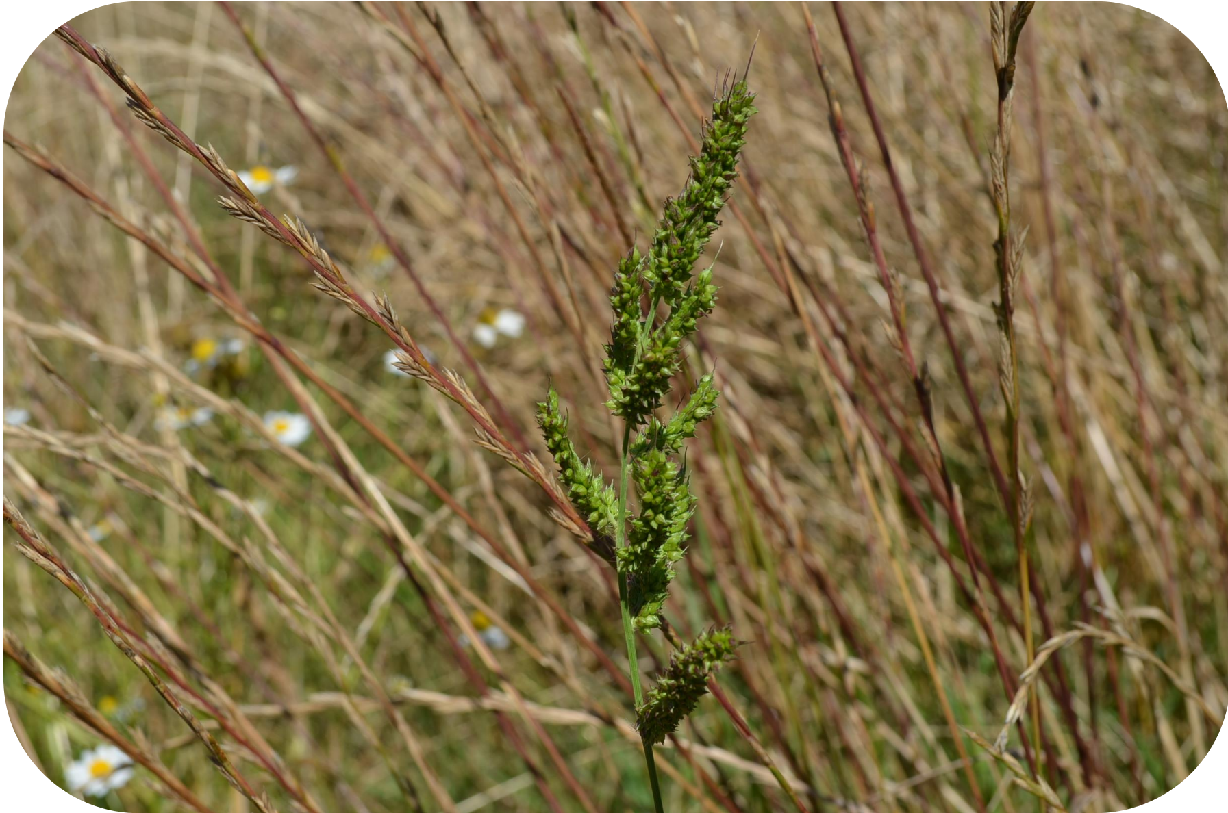
Echinochloa colona (L.) Link Hualcacho Ciclo anual