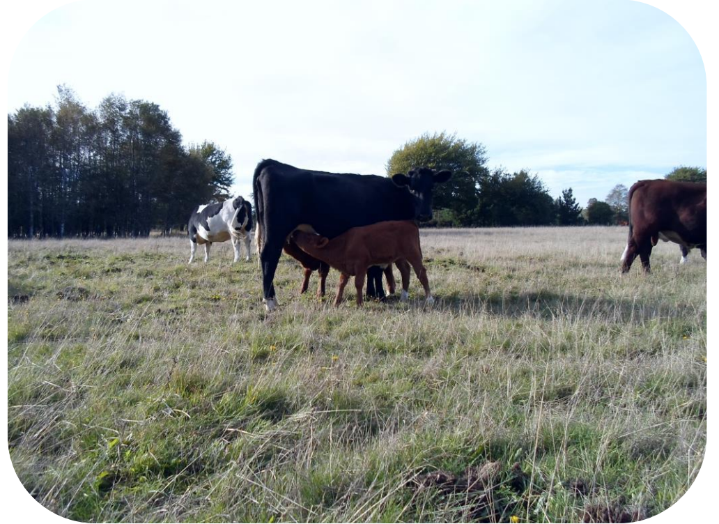
Año 1 Consumo del rastrojo