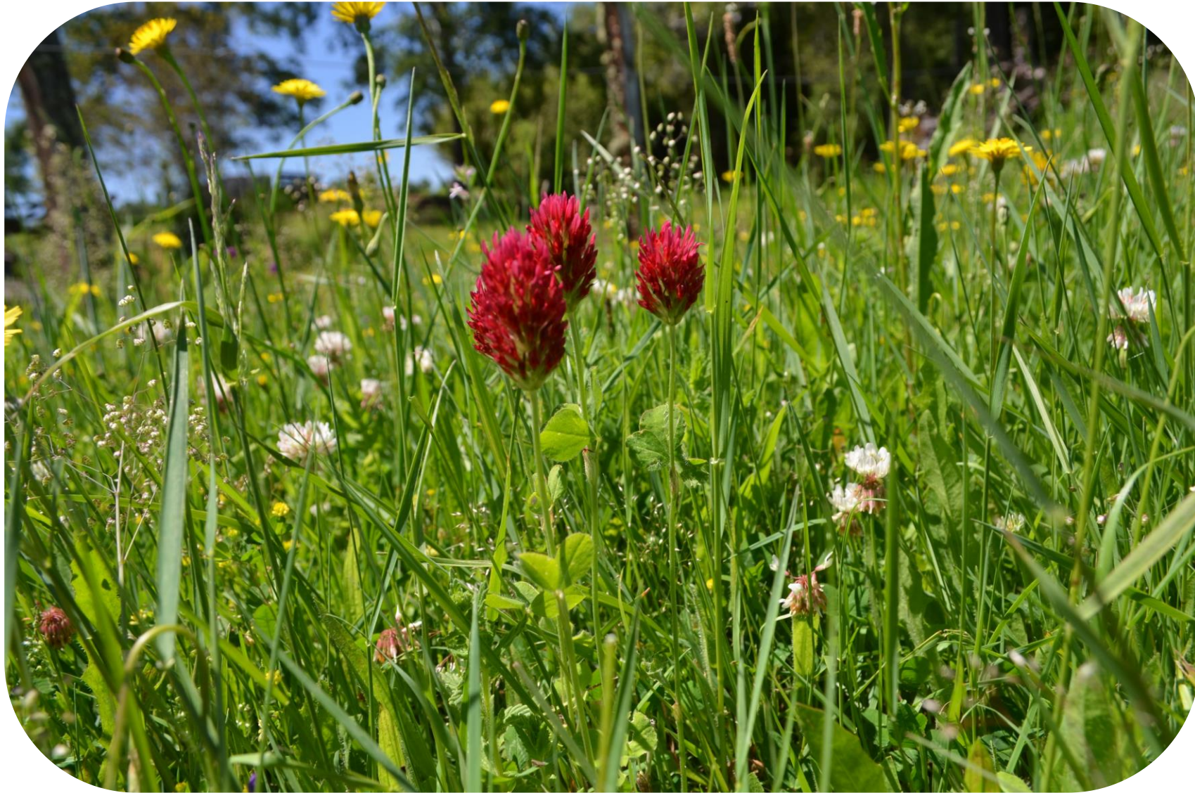
Trifolium incarnatum L. Trébol encarnado Ciclo anual