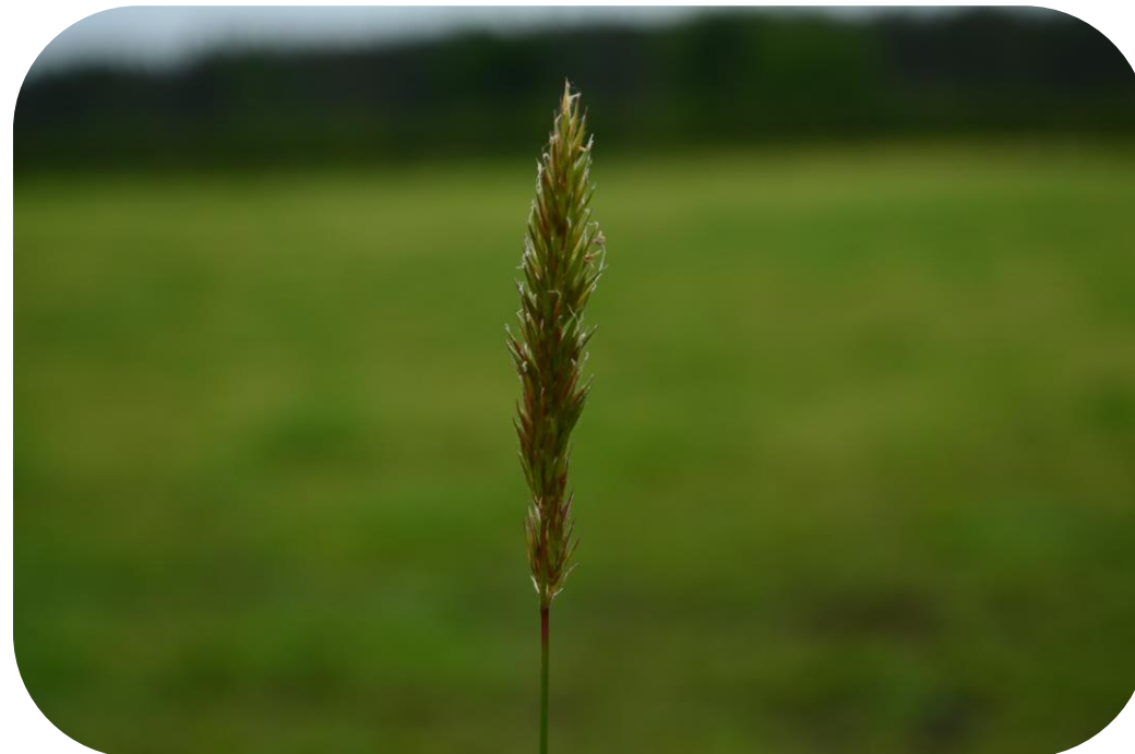
Anthoxanthum odoratum L. Pasto oloroso Ciclo anual