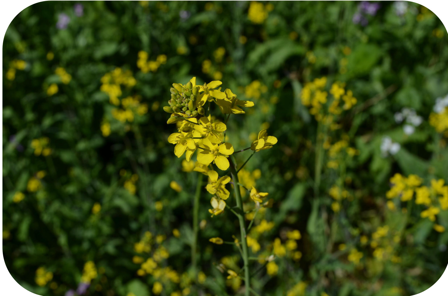
Brassica rapa L. Yuyo Ciclo anual