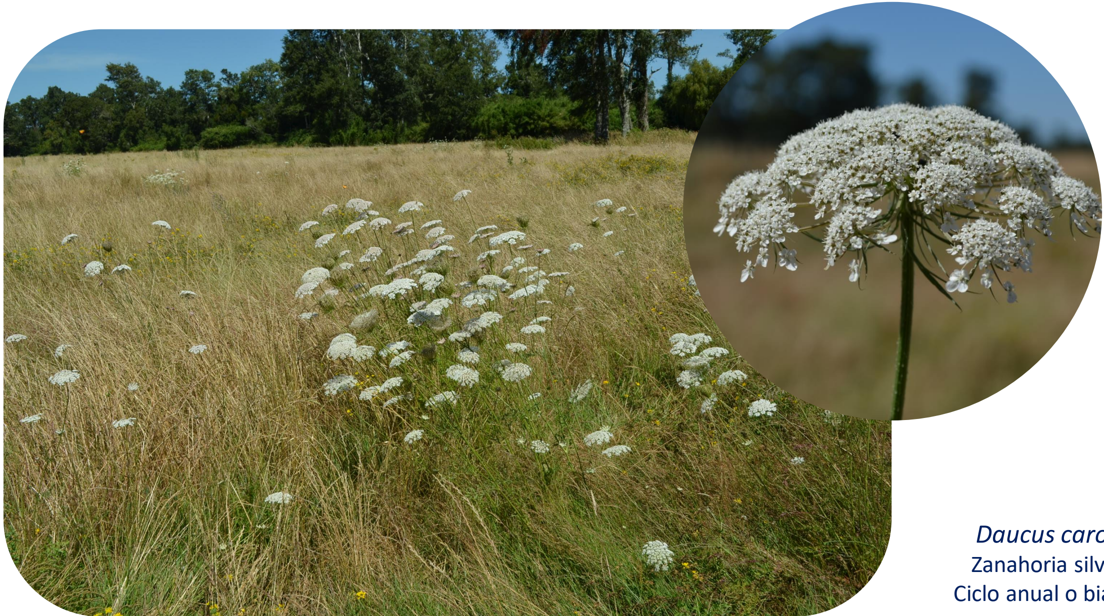
Daucus carota L. Zanahoria silvestre Ciclo anual o bianual