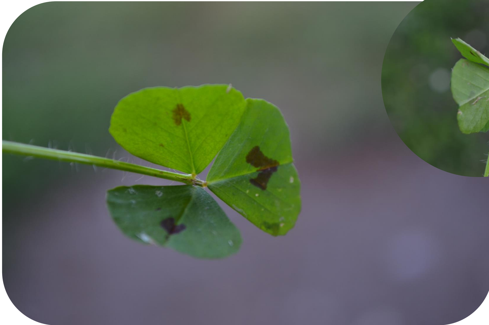
Medicago arabica (L.) Huds. Hualputra Ciclo anual