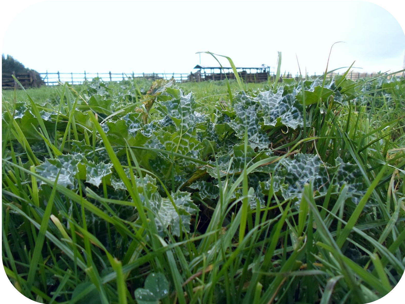
Silybum marianum (L.) Gaertn. Cardo blanco Ciclo anual