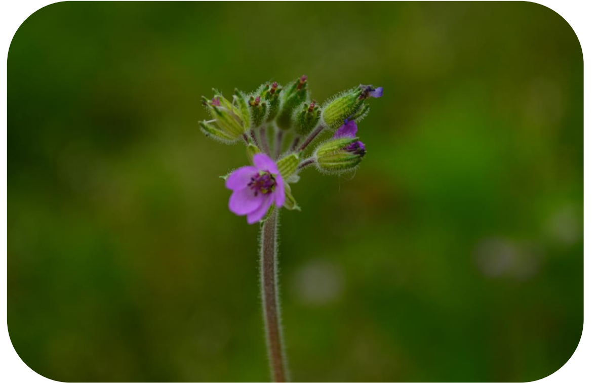
Erodium moschatum (L.) L'Hérit. Alfilerillo Ciclo anual