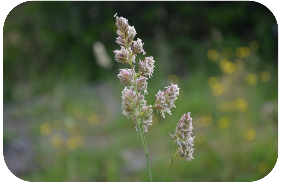
Dactylis glomerata L. Pasto ovillo Ciclo perenne