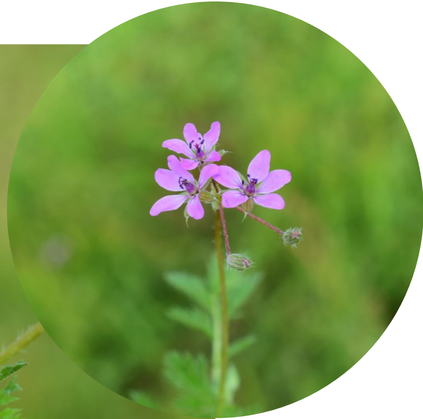
Erodium cicutarium (L.) L'Hérit. Alfilerillo Ciclo anual