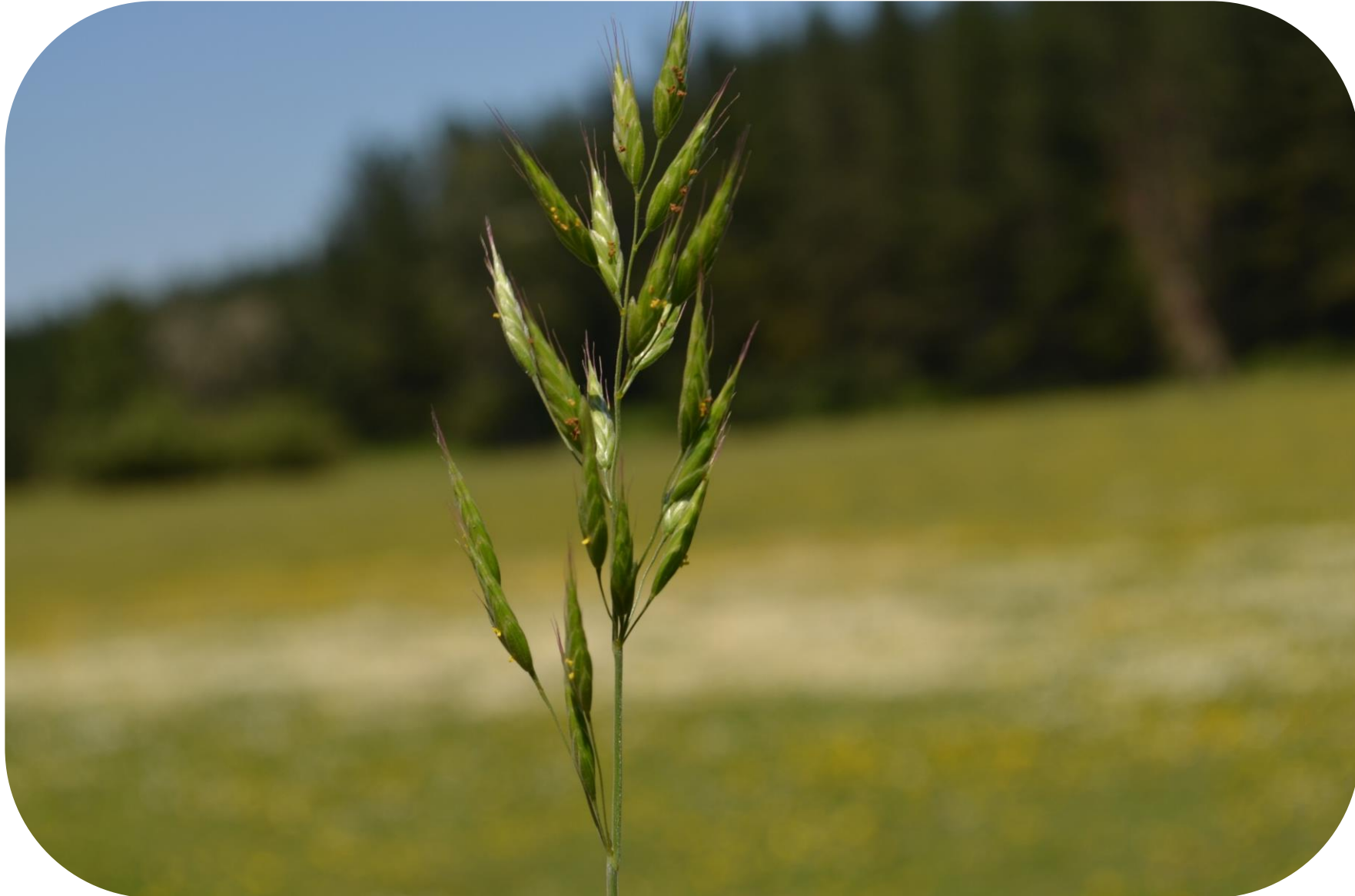
Bromus hordeaceus L. syn. Bromus mollis L. Bromo Cebadilla Ciclo anual