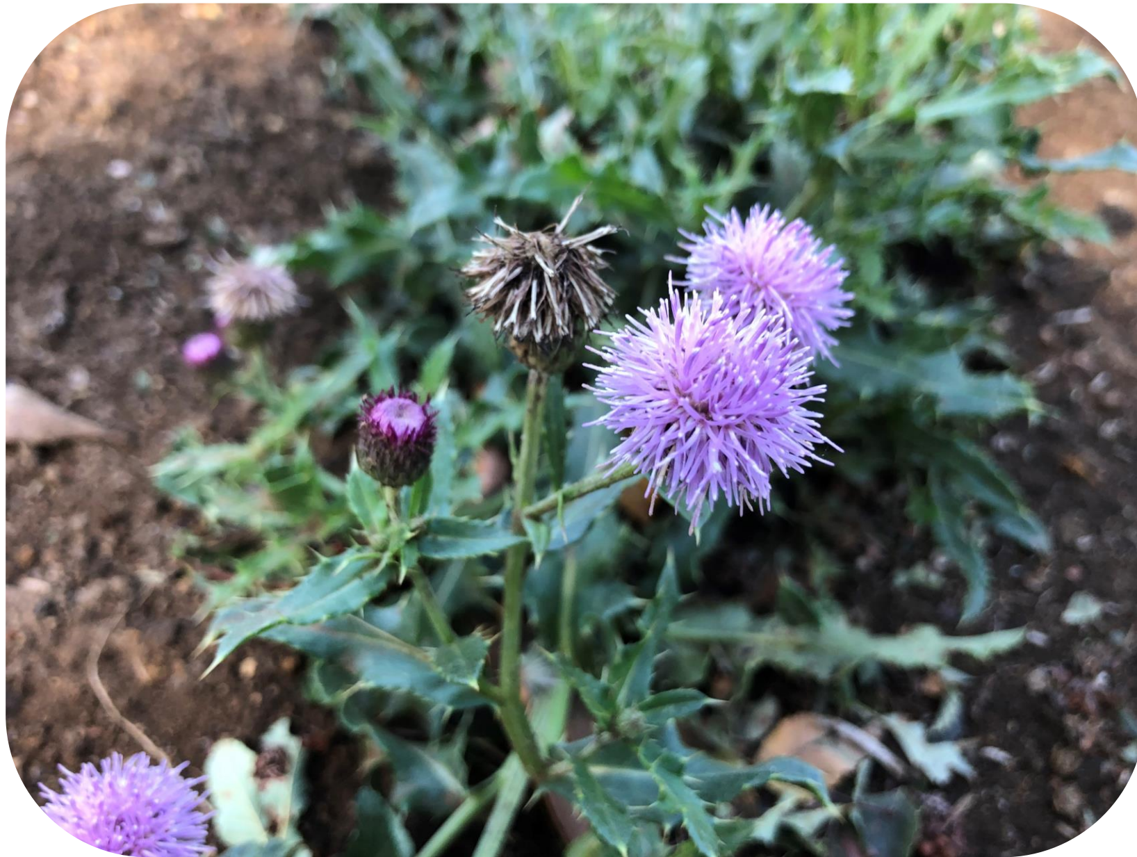
Cirsium arvense (L.) Scop. Cardo de Canadá Ciclo perenne