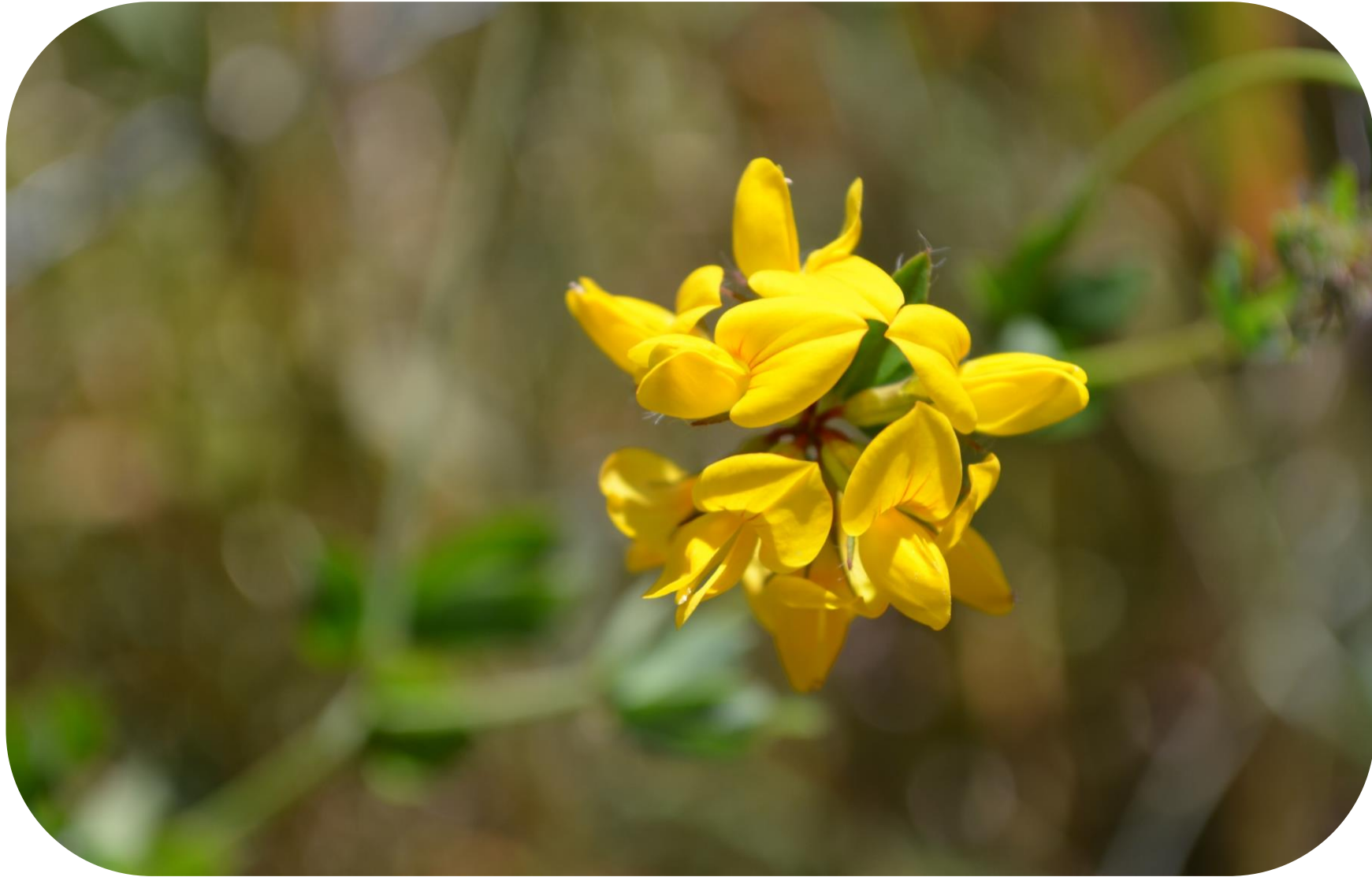
Lotus uliginosus Schkuhr Alfalfa chilota Loterá Ciclo perenne