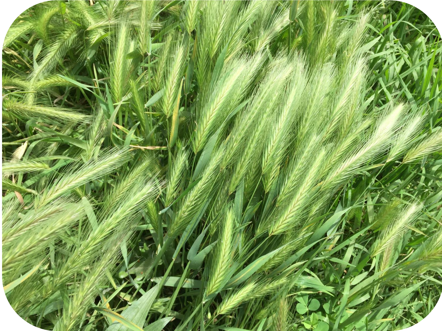
Hordeum murinum L. Cebadilla Ciclo anual