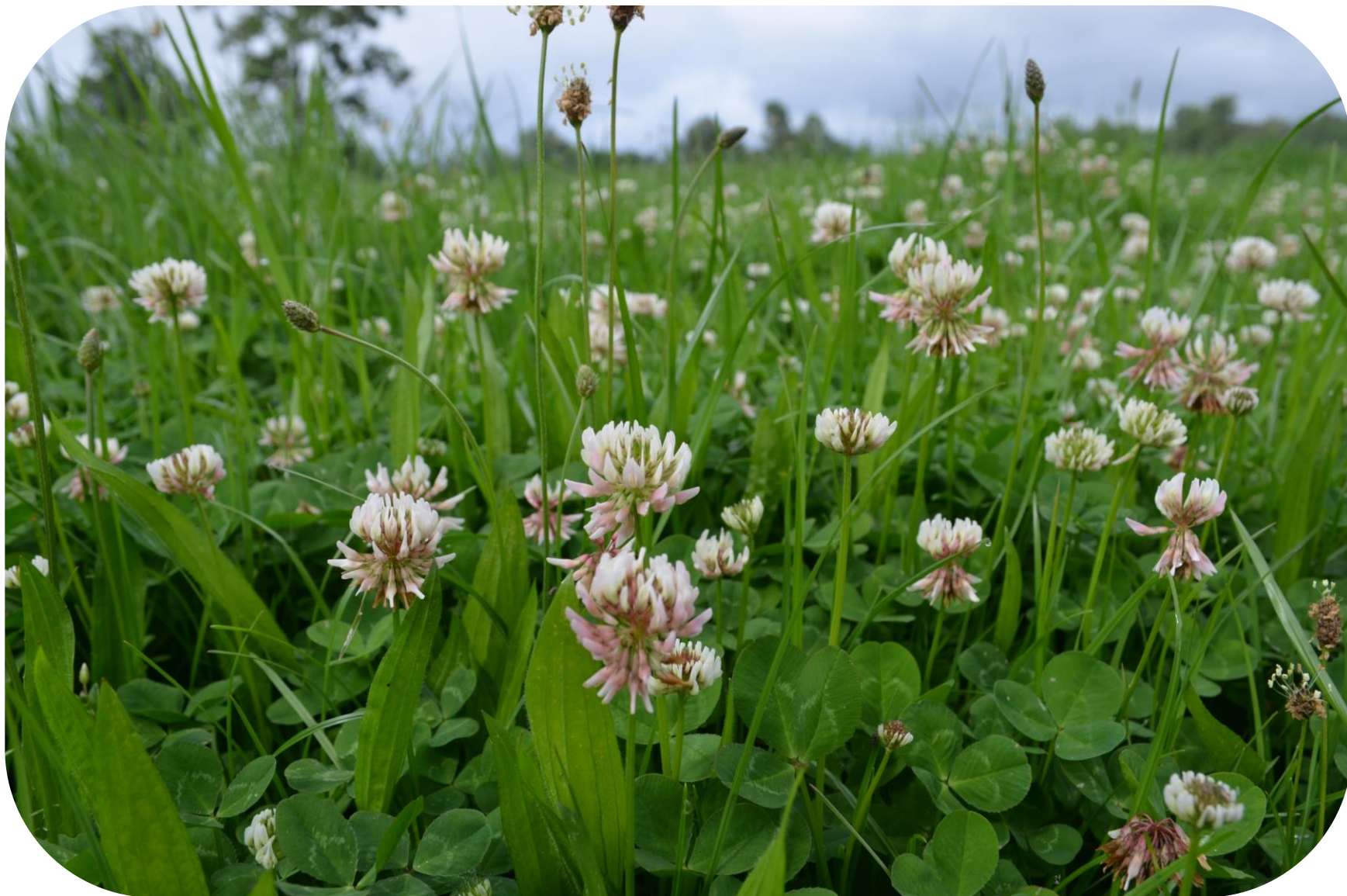
Trifolium repens L. Trébol blanco Ciclo perenne