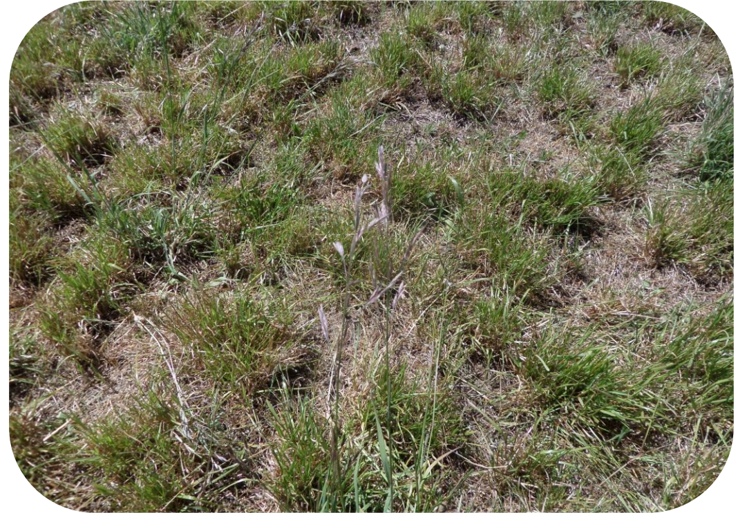
Año 2 Baja cobertura