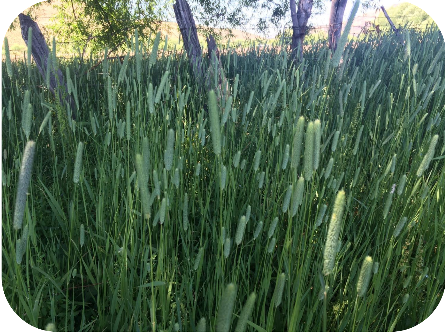
Phleum pratense L. Fleo