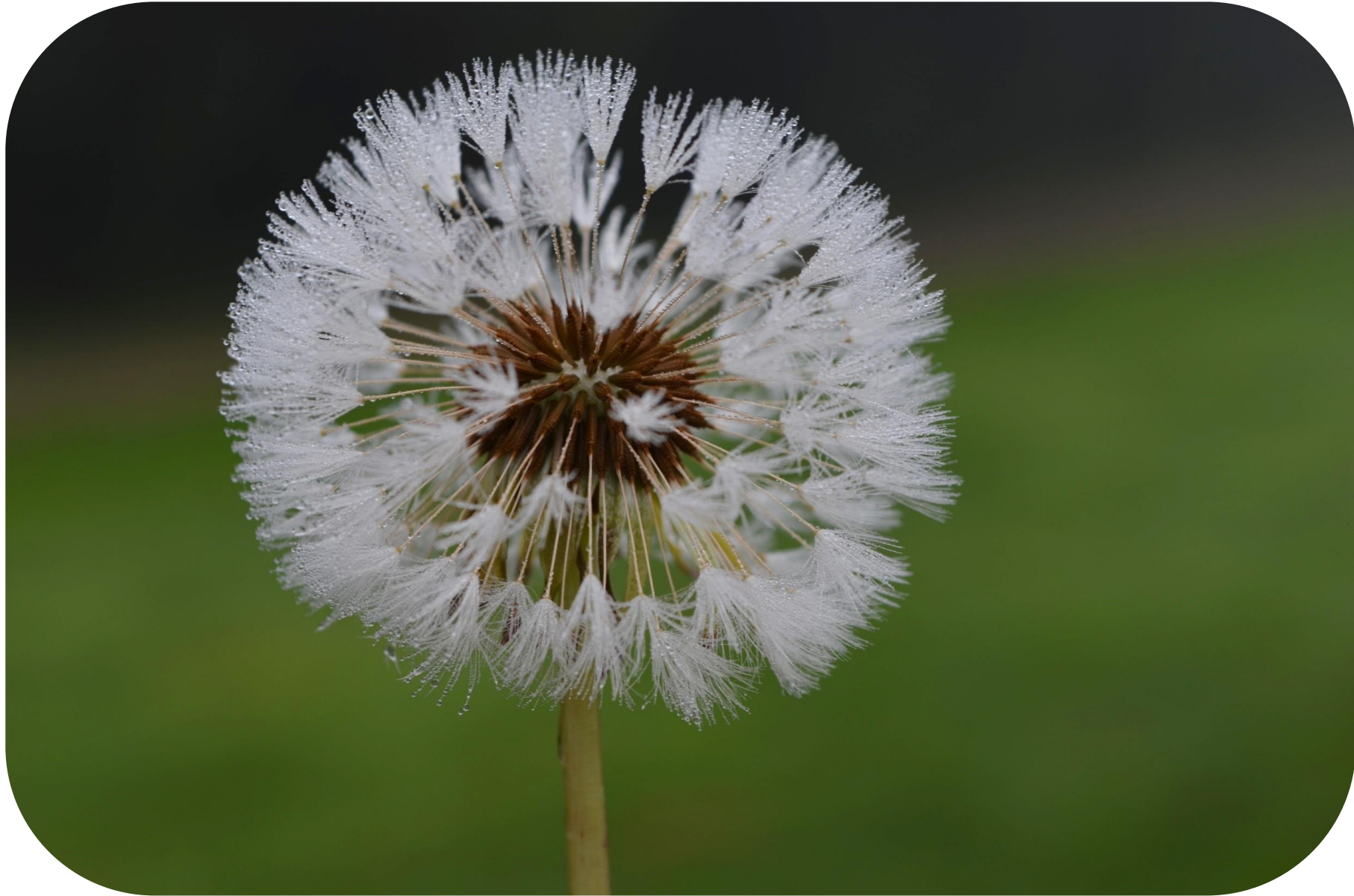
Hypochaeris radicata L. Pasto del chancho Ciclo anual