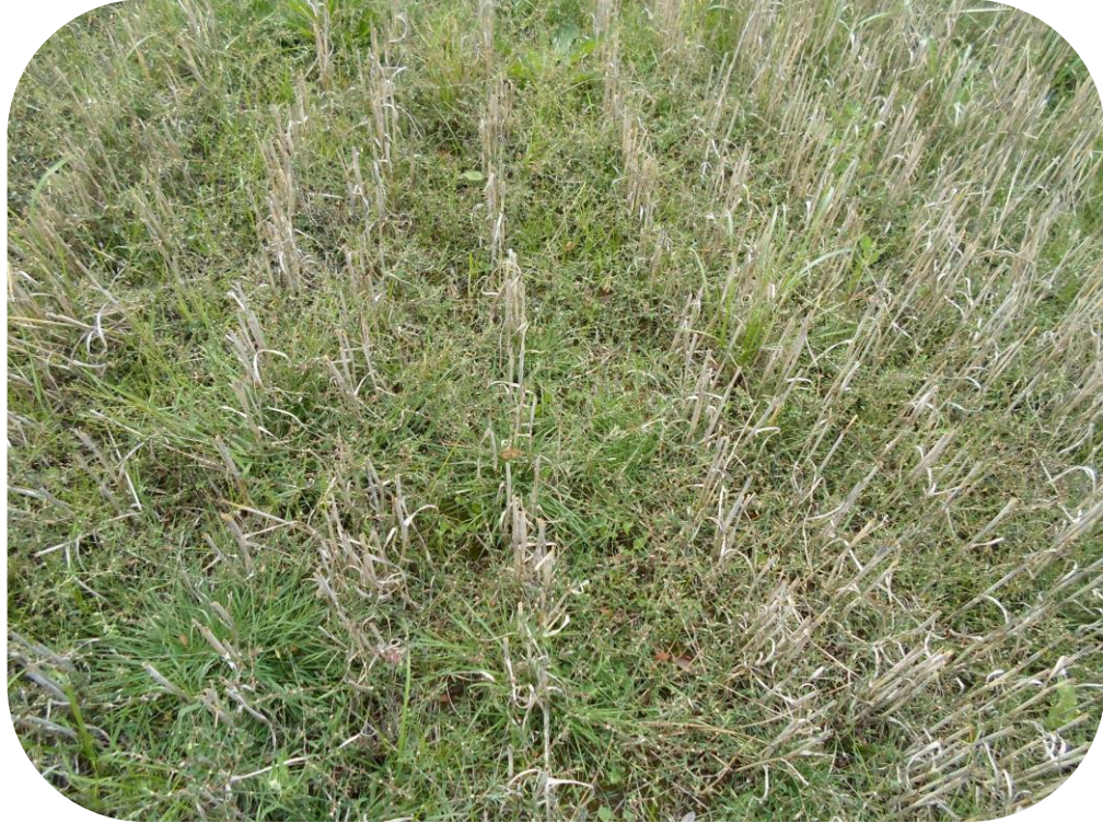
Año 1 Rastrojo de cereal