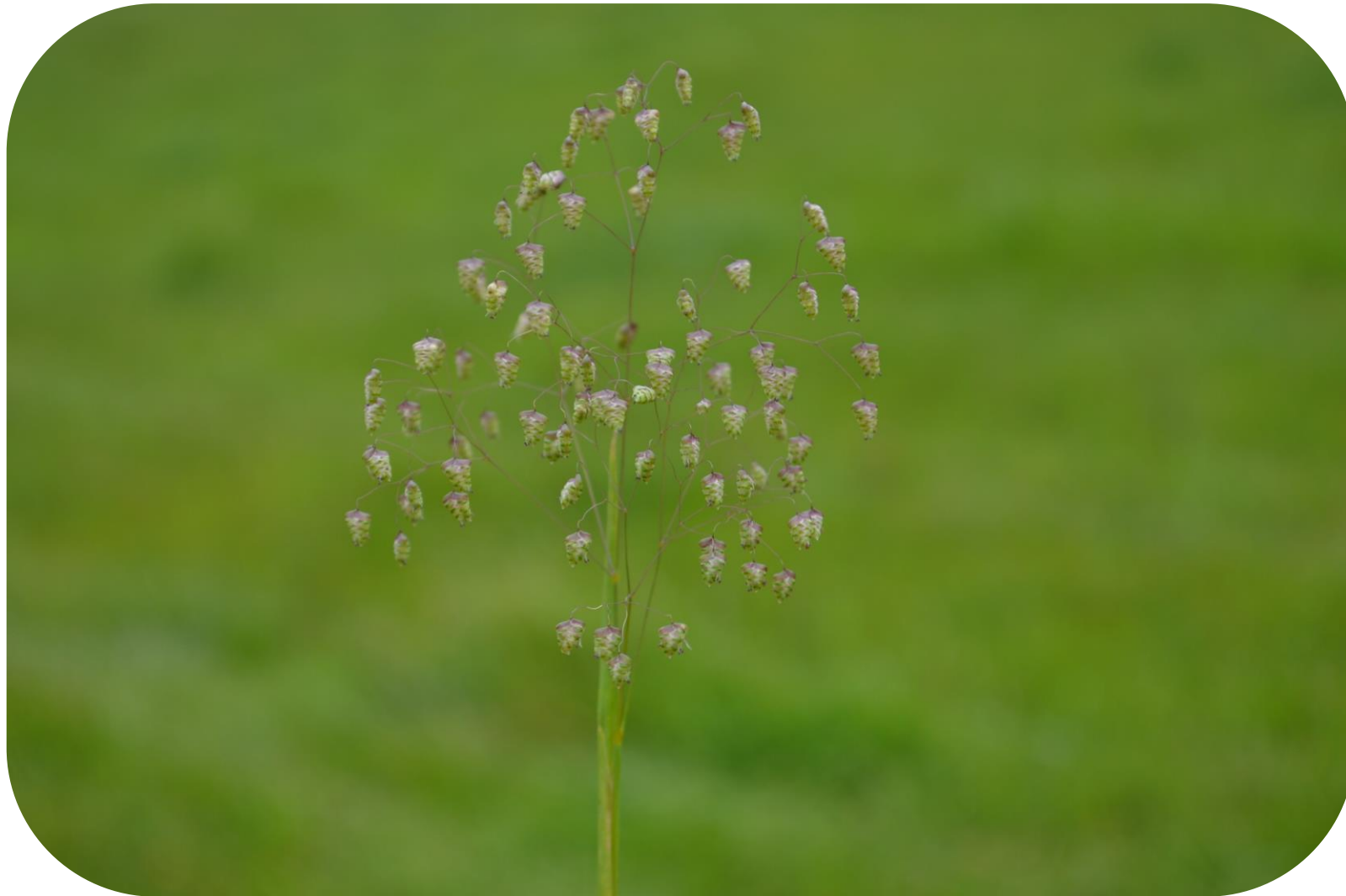
Briza minor L. Tembladera Ciclo anual