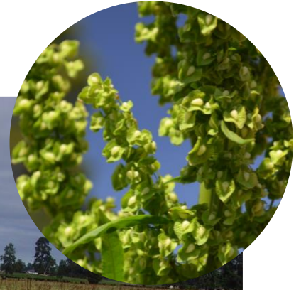
Rumex crispus L. Romaza Ciclo anual