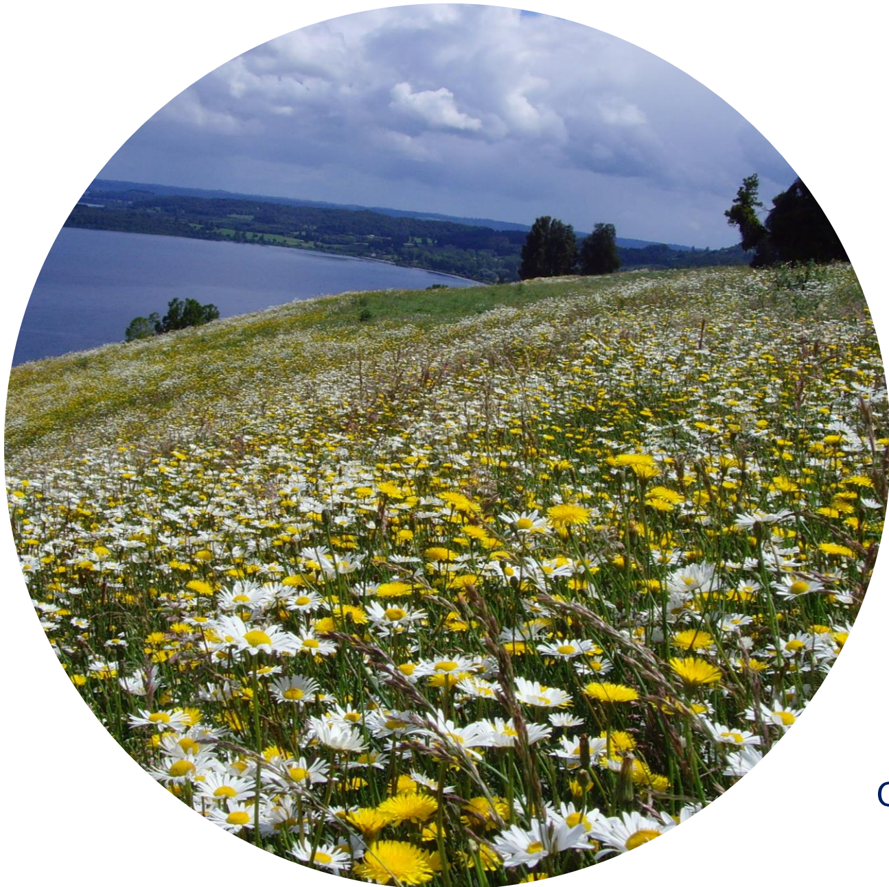
Composición botánica del pastizal templado