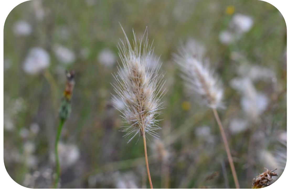
Cynosurus echinatus L. Cola de zorro Ciclo anual