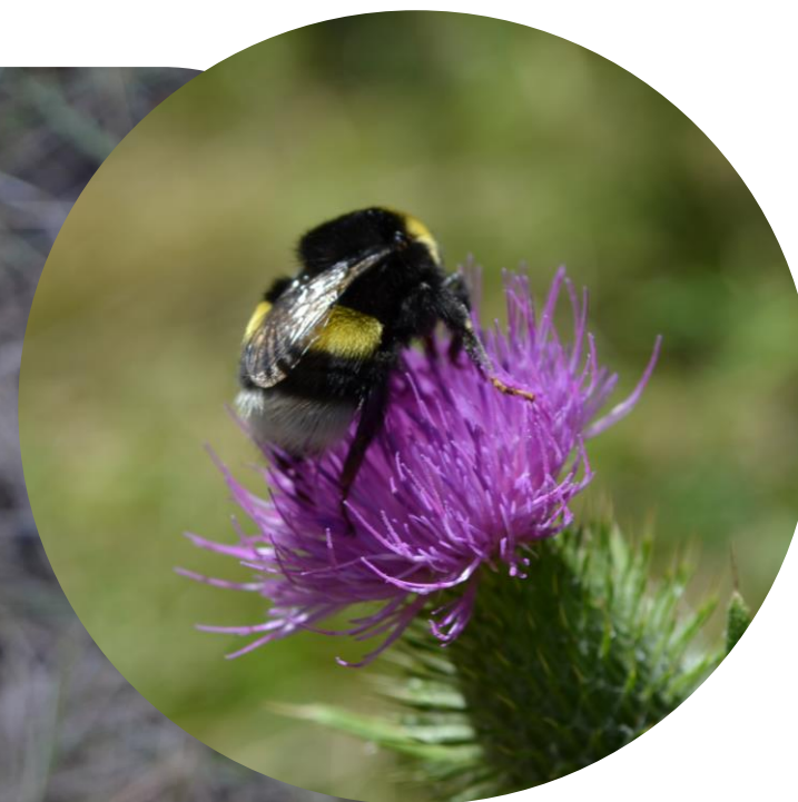
Cirsium vulgare (Savi) Ten. Cardo negro Ciclo anual