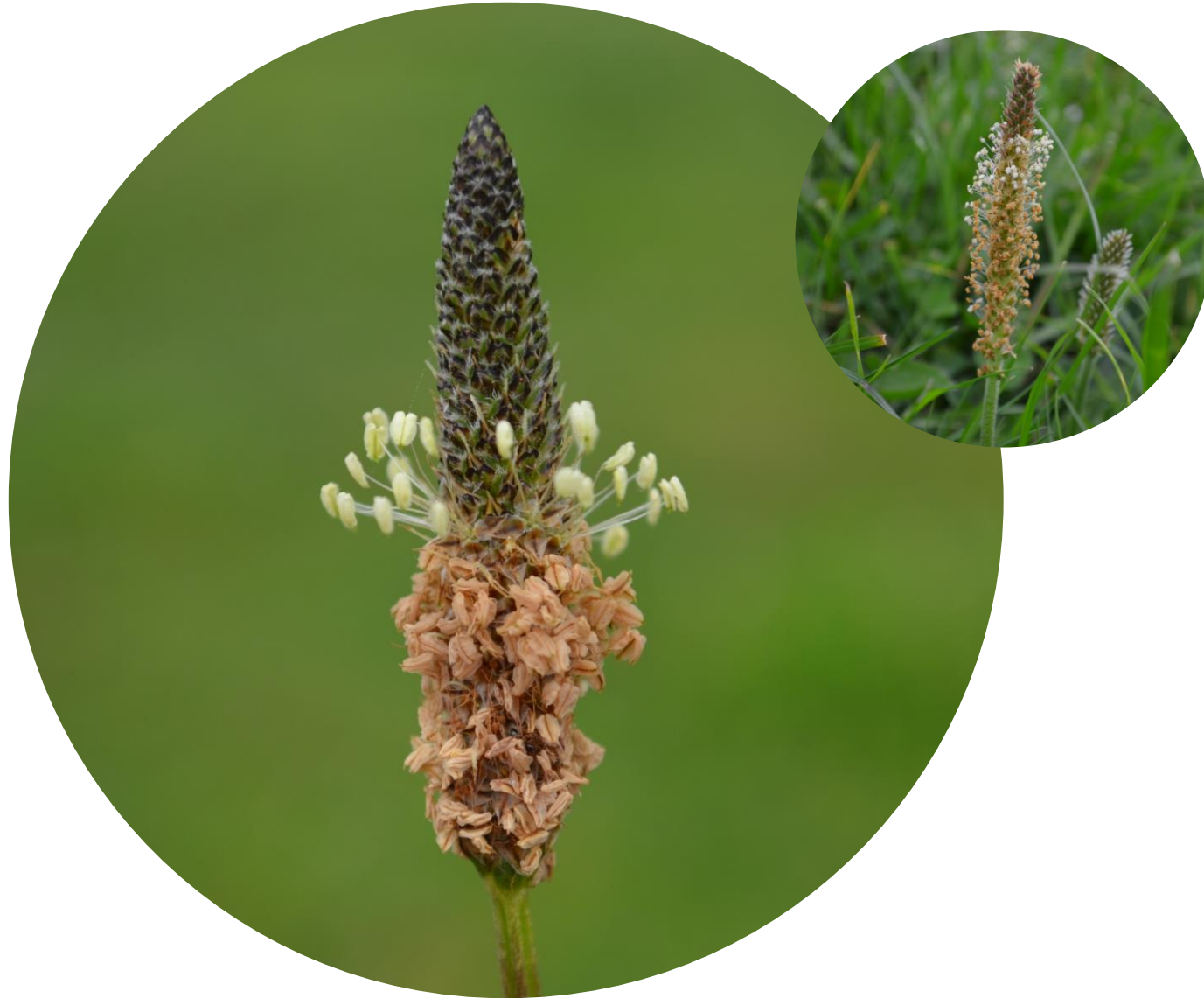
Plantago lanceolata L. Siete venas Ciclo perenne