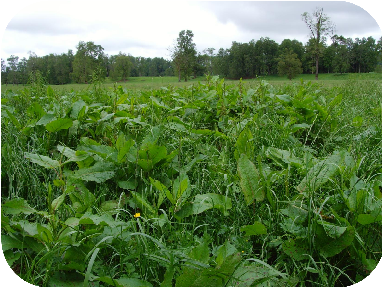
Rumex crispus L. Romaza