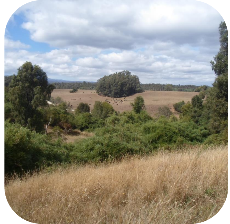
Sistemogénesis de un pastizal naturalizado de la zona templada