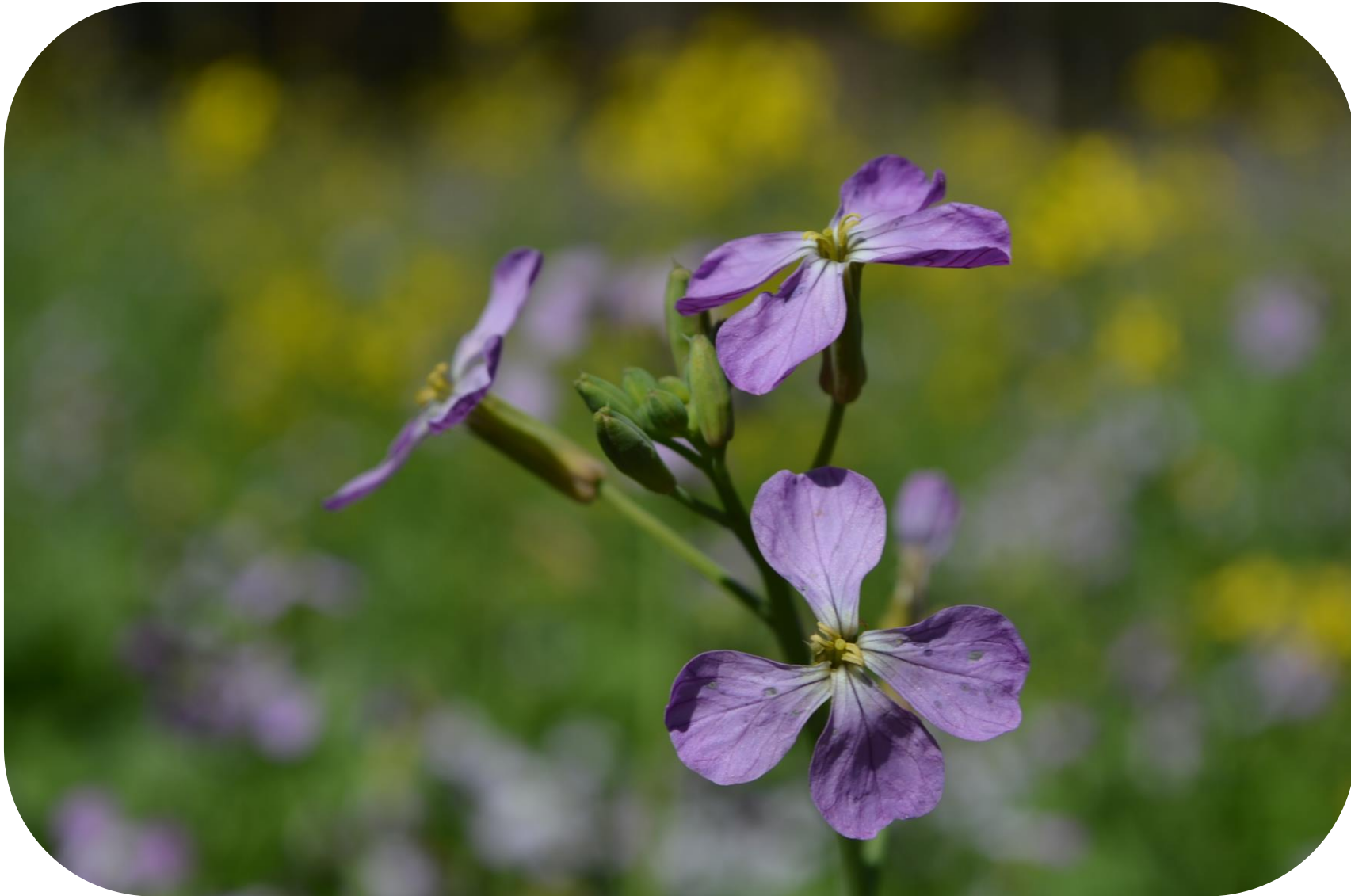
Raphanus sativus L. Rábano Ciclo anual o bianual