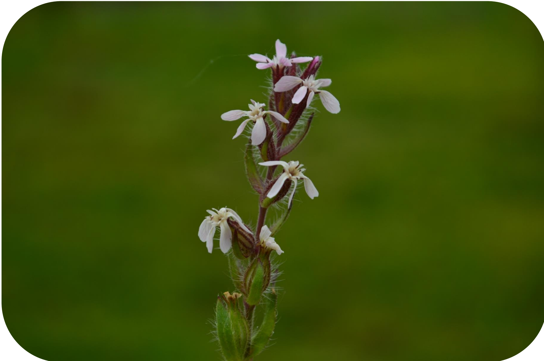
Silene gallica L. Calabacillo Ciclo anual