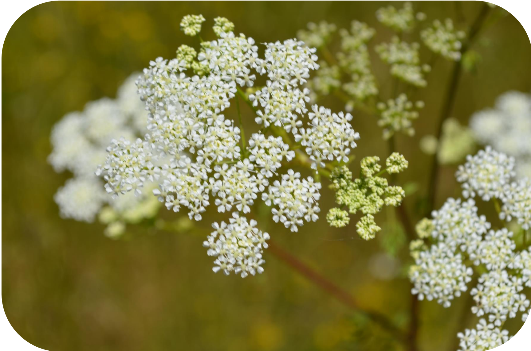
Conium maculatum L. Cicuta Ciclo anual o bianual