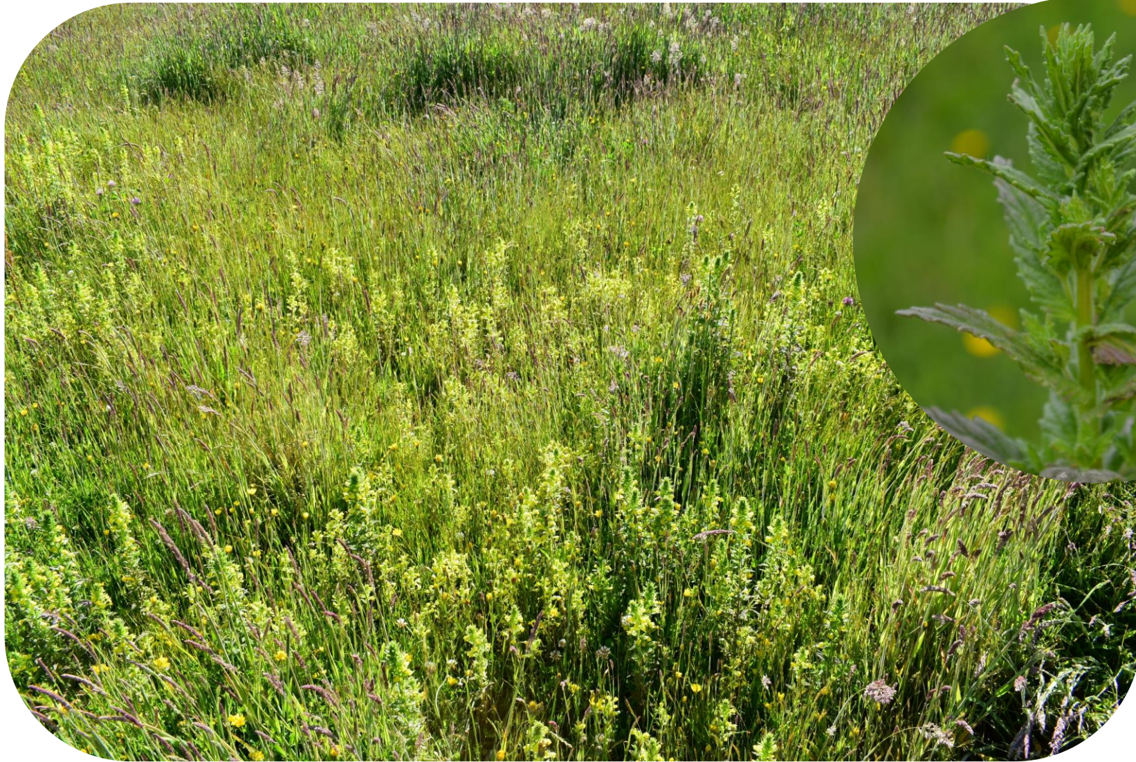
Parentucellia viscosa (L.) Caruel Pegajosa Ciclo anual