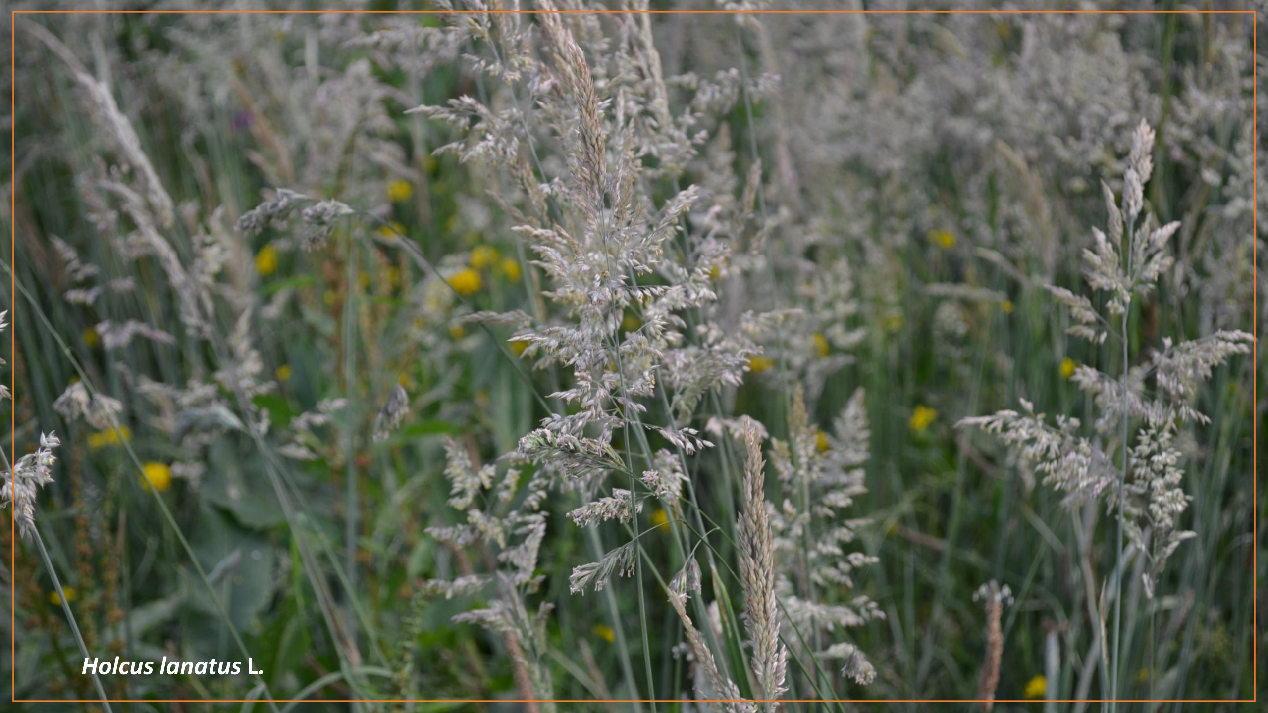
Holcus lanatus L.