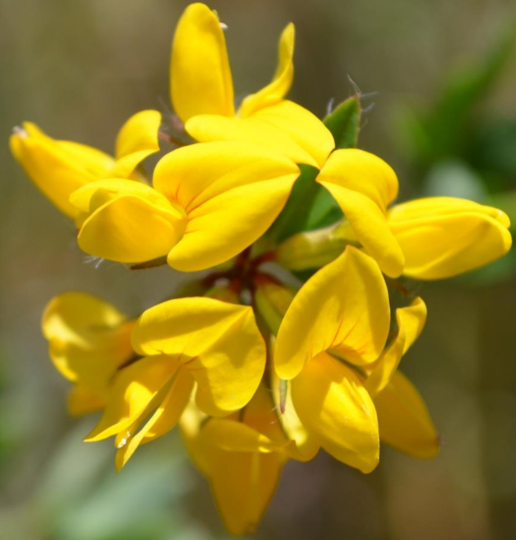
Lotus pedunculatus Cav.