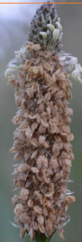
Plantago lanceolata L.