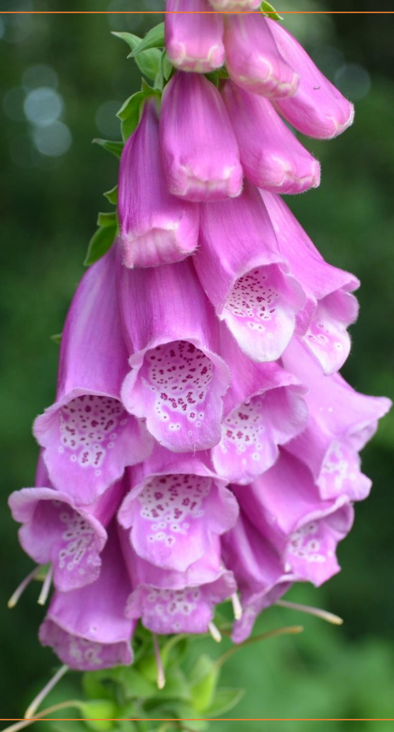
Digitalis purpurea L.