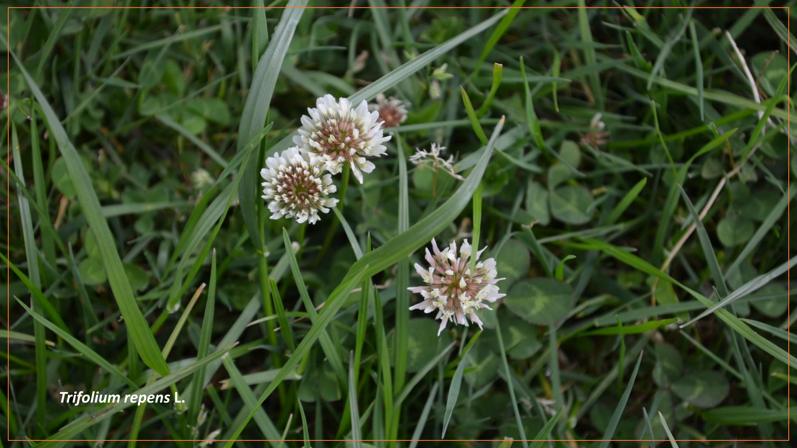
Trifolium repens L.