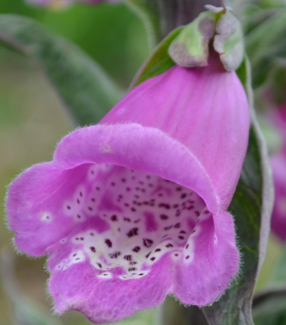
Digitalis purpurea L.