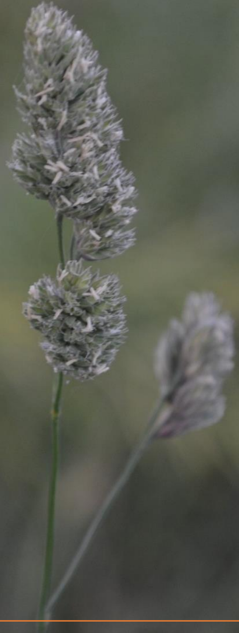
Dactylis glomerata L.