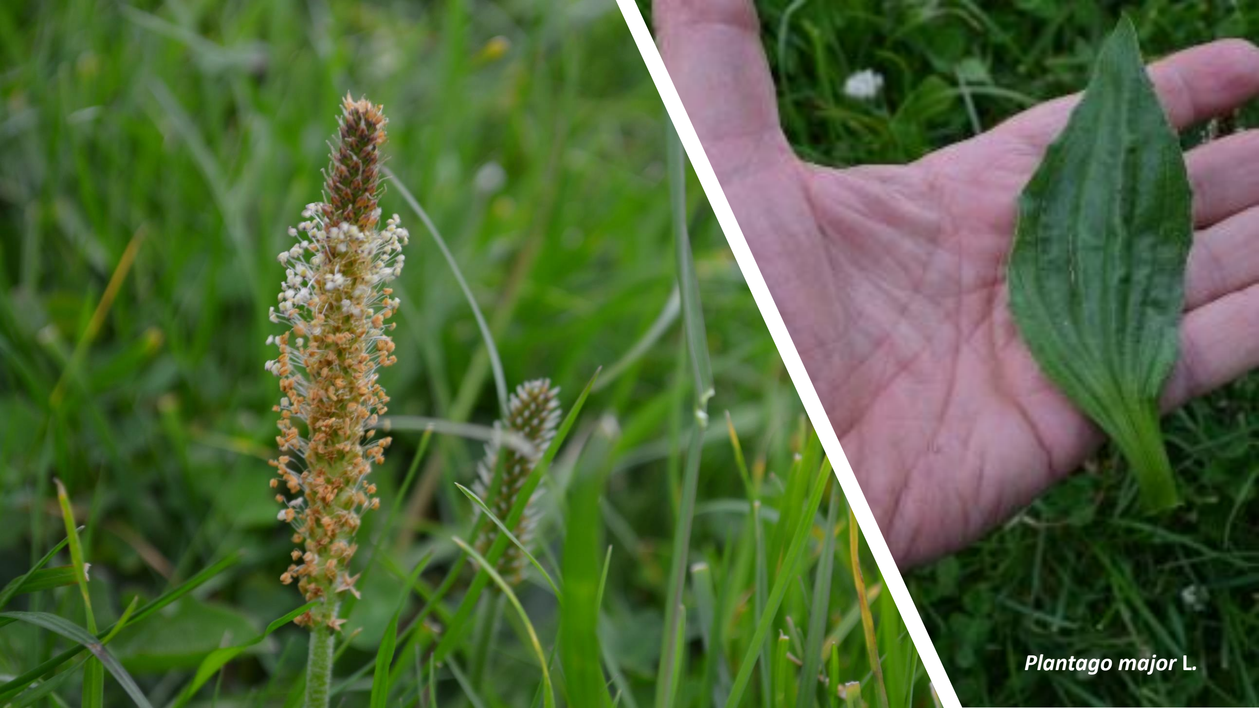
Plantago major L.