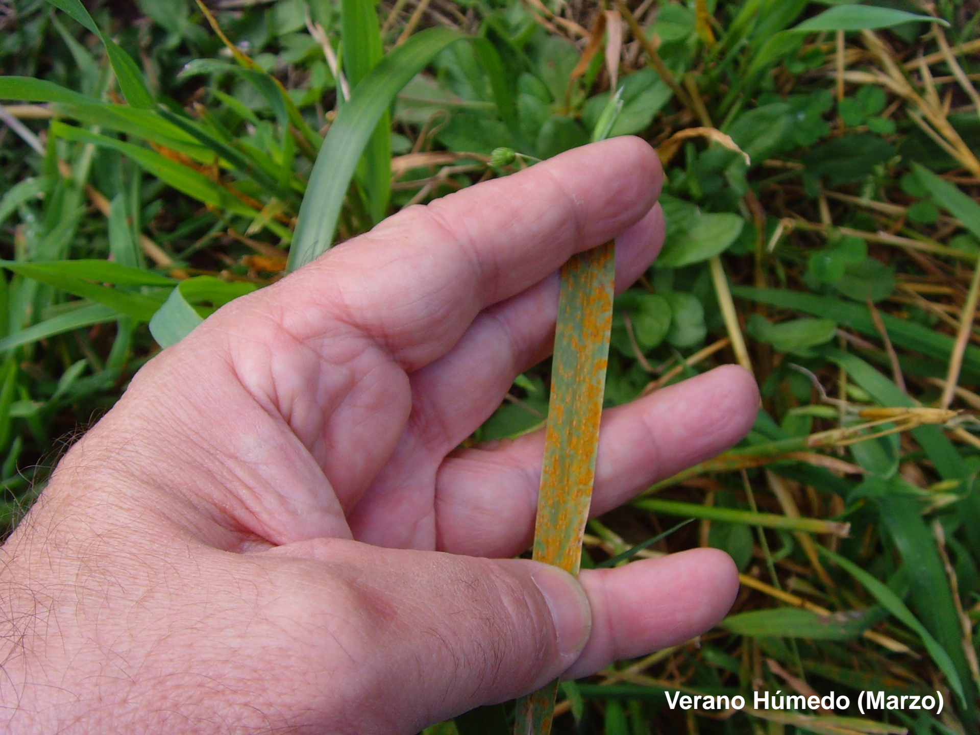
Verano Húmedo (Marzo)