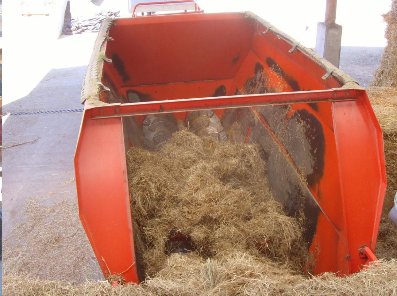
Colecta y mezcla de alimentos (TMR)