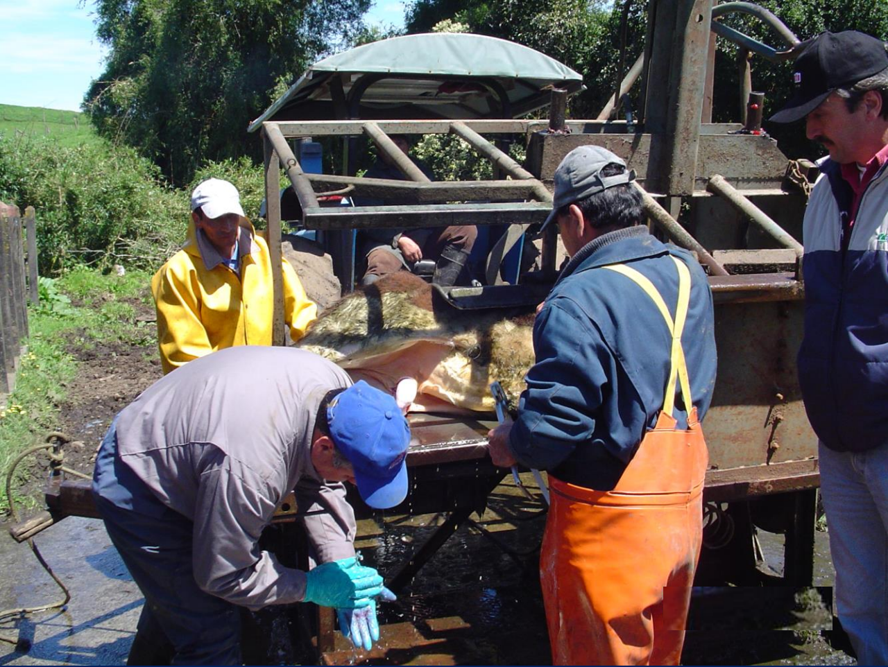
Castración a testículo abierto