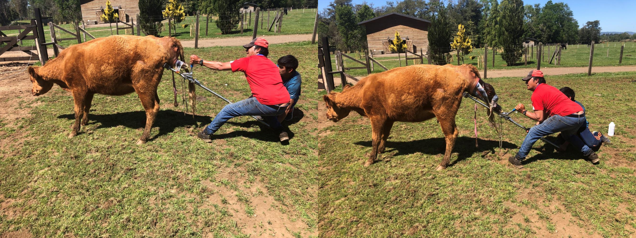
Extracción de manos y cabeza