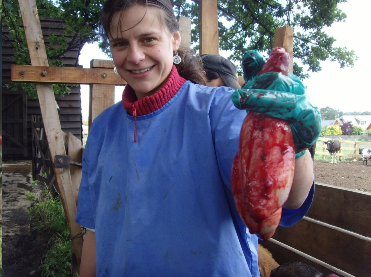
Extracción de los testículos