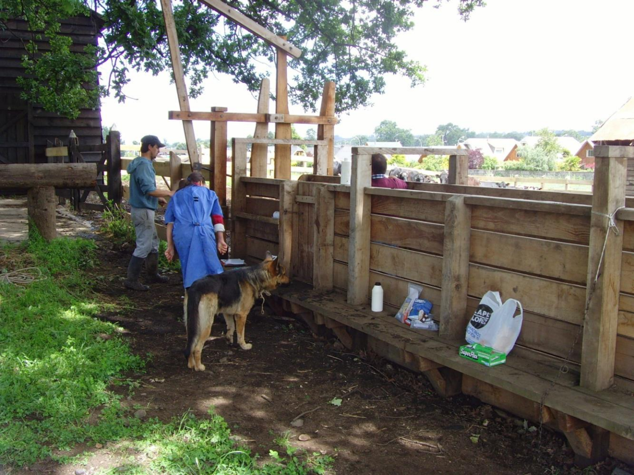
Ubicación del animal en la manga