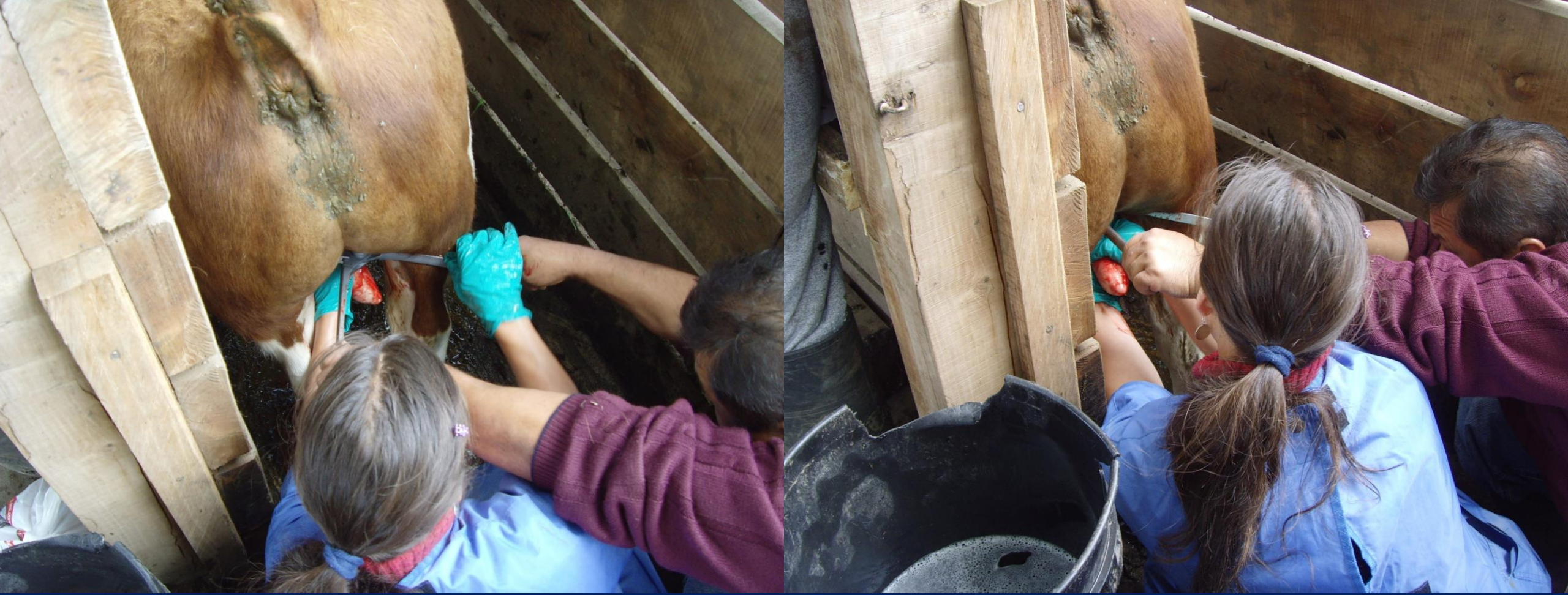
Ubicación del emasculador en el cordón espermático