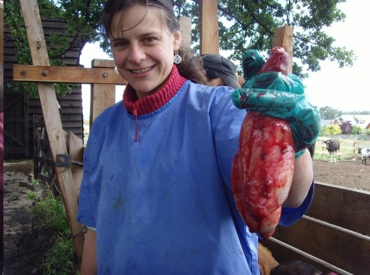
Castración en Bovinos de Carne