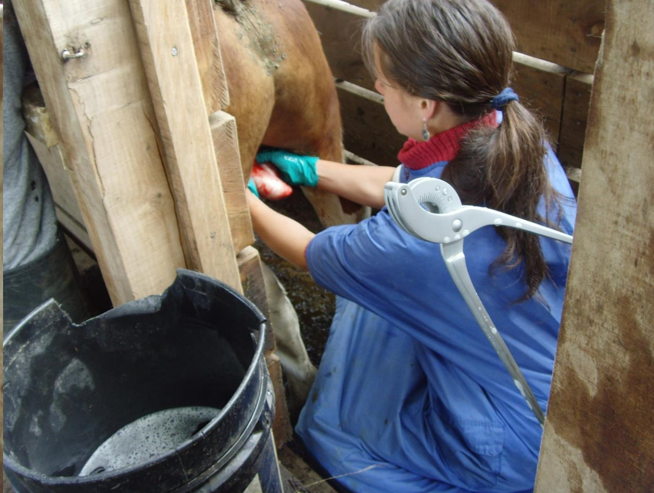
Extensión del cordón espermático