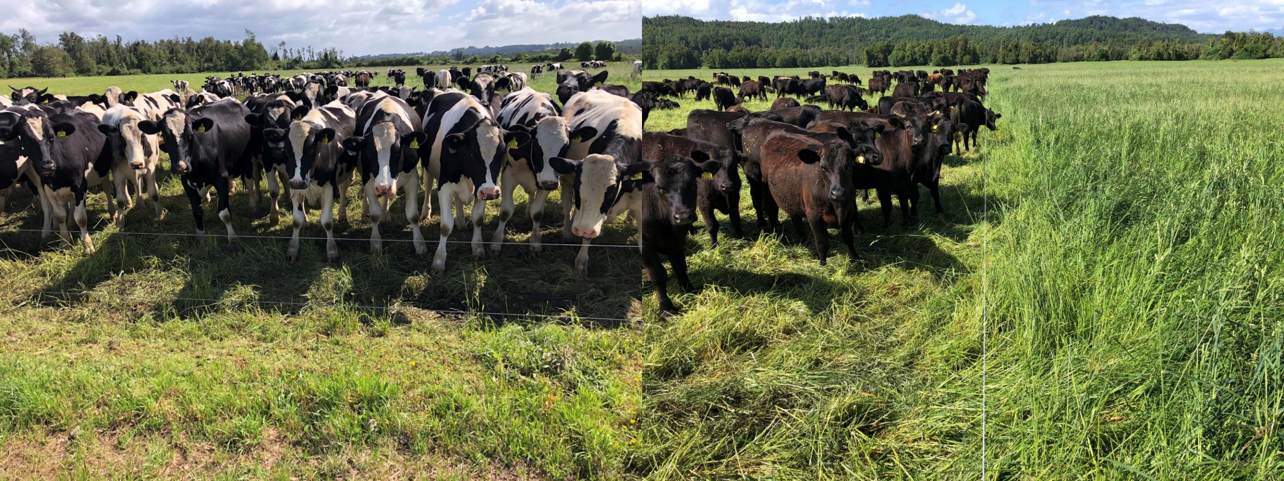
Machos provenientes de lechería