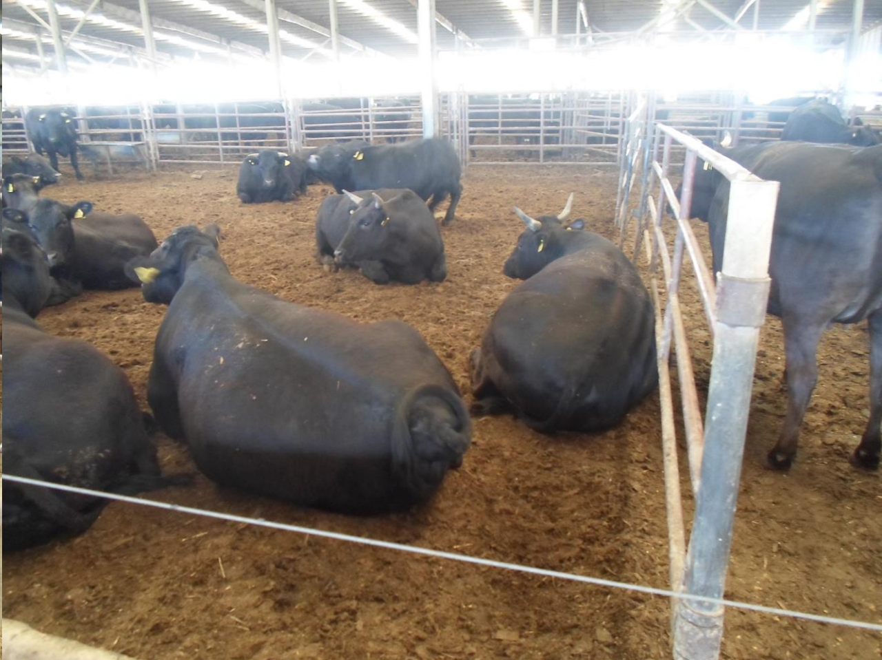
Híbridos Waygu – Angus negro