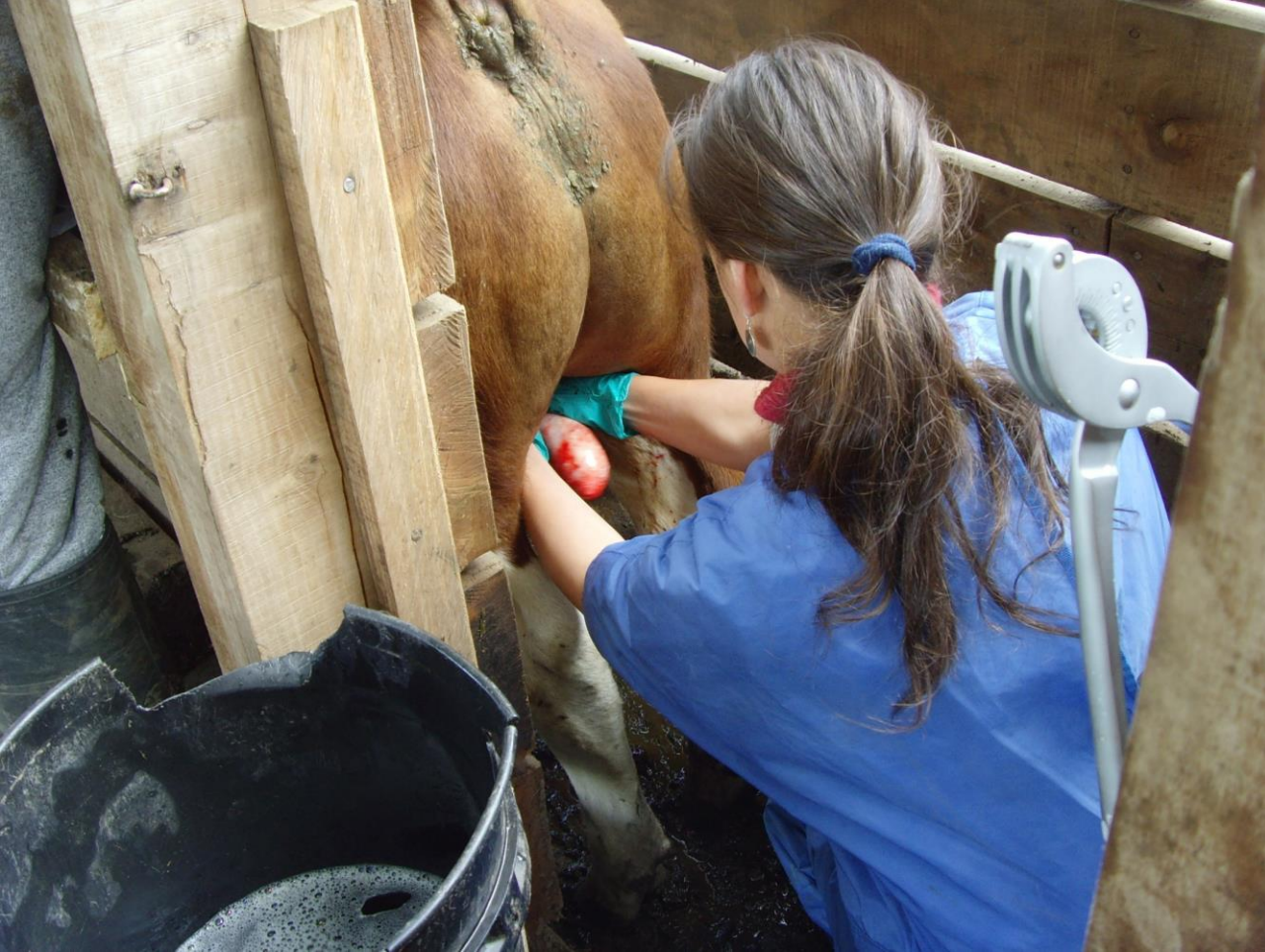
Corte del escroto y visualización de testículos